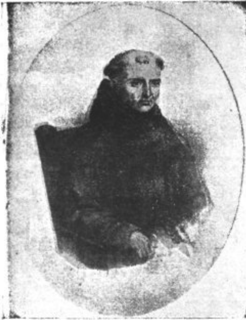
FRAY JUNIPERO SERRA O. F. M.