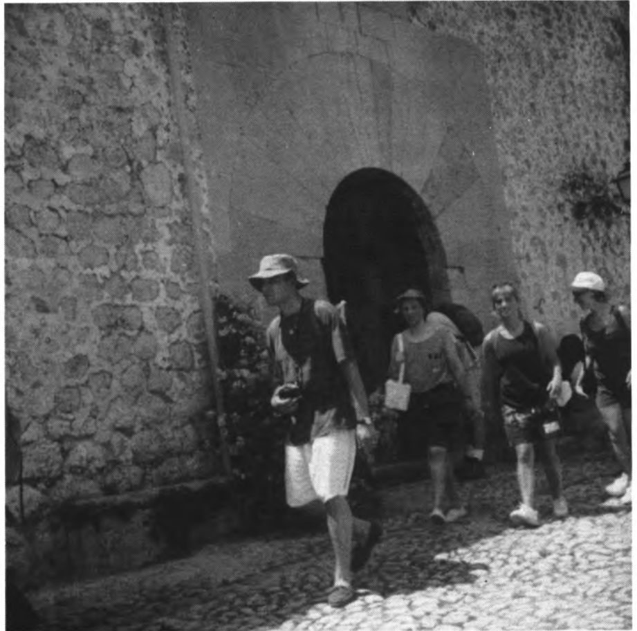
Grup d'excursionistes pel camí del Rost, davant la possessió de Can Prohom