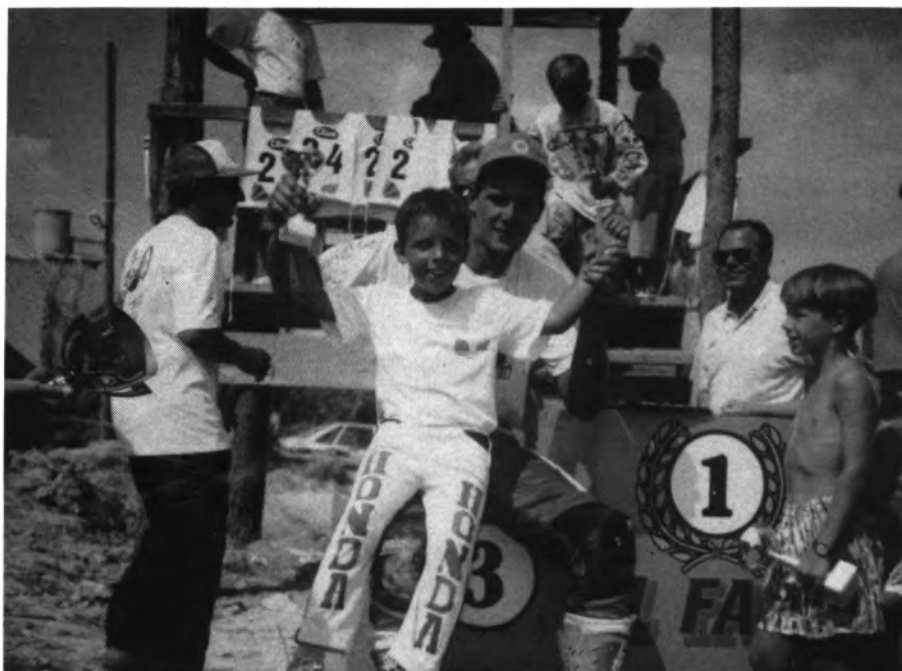
Heinz Quinigadner, Campió del Món dues vegades, al circuit Fora Vila de Muro