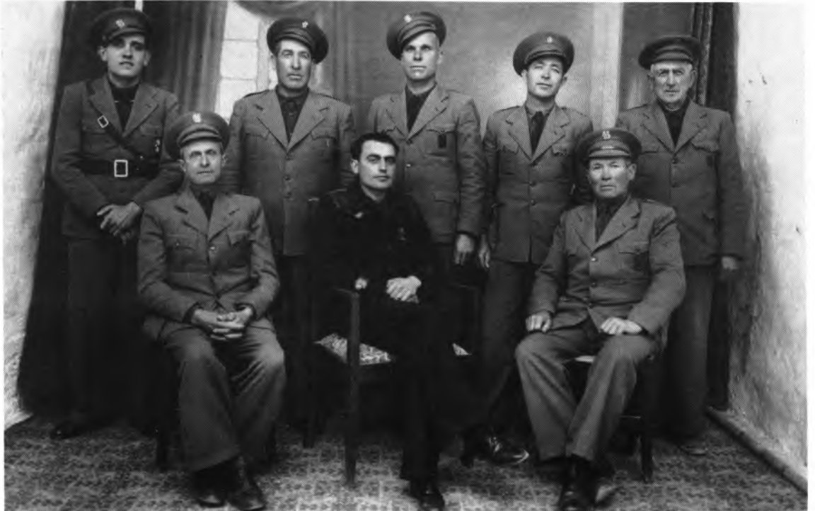
Fotografia de l'any 1941