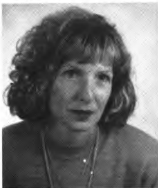
Regidora Delegada de la guarderia.

- Des de l'àrea d'assumptes socials, com veu i quin tractament es donarà al tema de la guarderia?