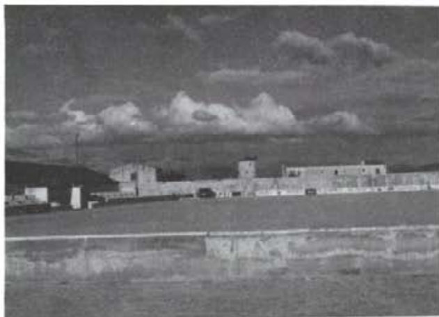
El C.D. Murense, el más subvencionado: 1.000.000 ptas.