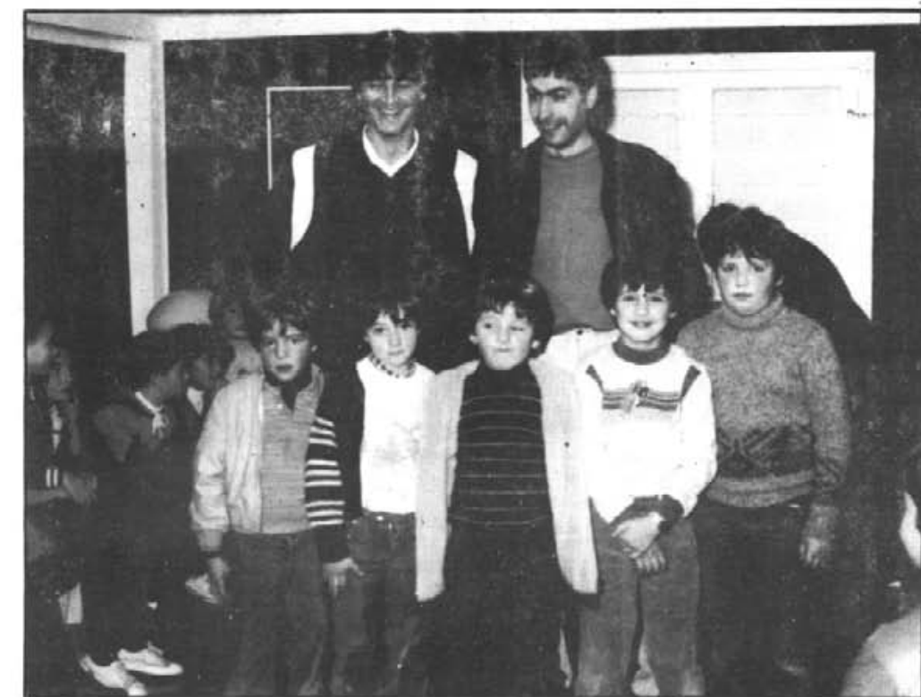
Parte de la Escuela de Tenis del Club de Manacor y sus monitores.

También para los días 25, 26 y 27 está previsto celebrarse en las Pistas del Tenis Manacor, la fase final del Campeonato de Baleares por equipos en la Categoría C, siendo en la actualidad el equipo de la Ciudad de las