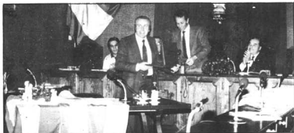
El Batle ha fet entrega de la plaça al pregoner.