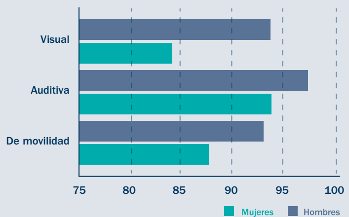
Brecha de género de uso del teléfono tradicional según tipo de discapacidad %

Otro ejemplo es el uso del teléfono móvil. Según un estudio de la Fundación Vodafone de 2013, el 93,3% de los hombres con discapacidad de movilidad utilizan el teléfono móvil frente al 87% de las mujeres. Una diferencia que se incrementa hasta 9 puntos porcentuales en la discapacidad visual (el 93,5% de los hombres frente al 84,4% de las mujeres) 45 .