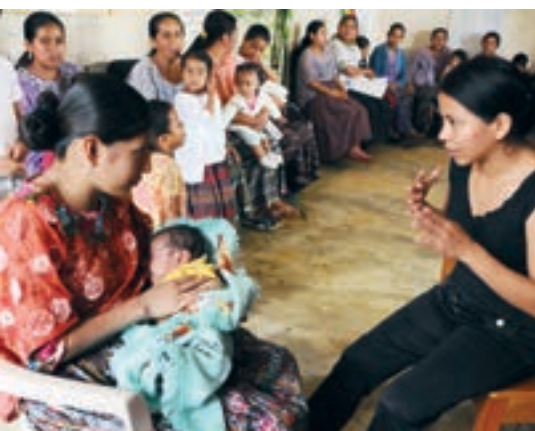
▲ Un trabajador de la salud habla con una mujer que amamanta a su hija en un centro de salud de la municipalidad de Cobán, Guatemala.

Afortunadamente para quienes toman las decisiones, las encuestas por hogares proporcionan las pruebas cruciales. Muchísimas personas responden estas