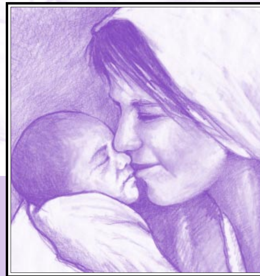
Ilustración en la tapa: Carol Larson, Prographics, Inc.

Para obtener más información, sírvase dirigirse a: