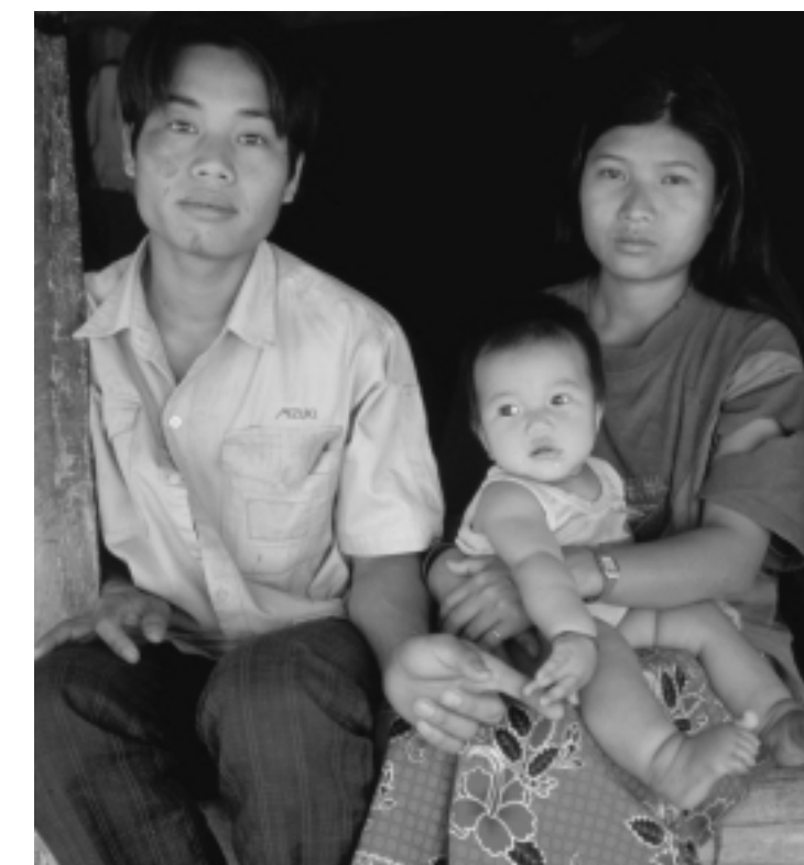
Una familia en Tailandia. El Gobierno de Tailandia, junto al UNICEF y las ONG, ha creado la Iniciativa de Educación sobre el VIH/SIDA, dirigida a los 19 millones de niños y niñas menores de 19 años.

Las actividades del UNICEF se basan en la Convención sobre los Derechos del Niño, el tratado de defensa de derechos humanos que ha recibido mayor respaldo en todo el mundo. Ganar la lucha contra el VIH/SIDA es una de las principales prioridades del UNICEF, debido a que esta enfermedad impide a millones de niños y de niñas disfrutar su derecho a vivir, a desarrollarse, a estar protegidos y a participar en las decisiones que les atañen.