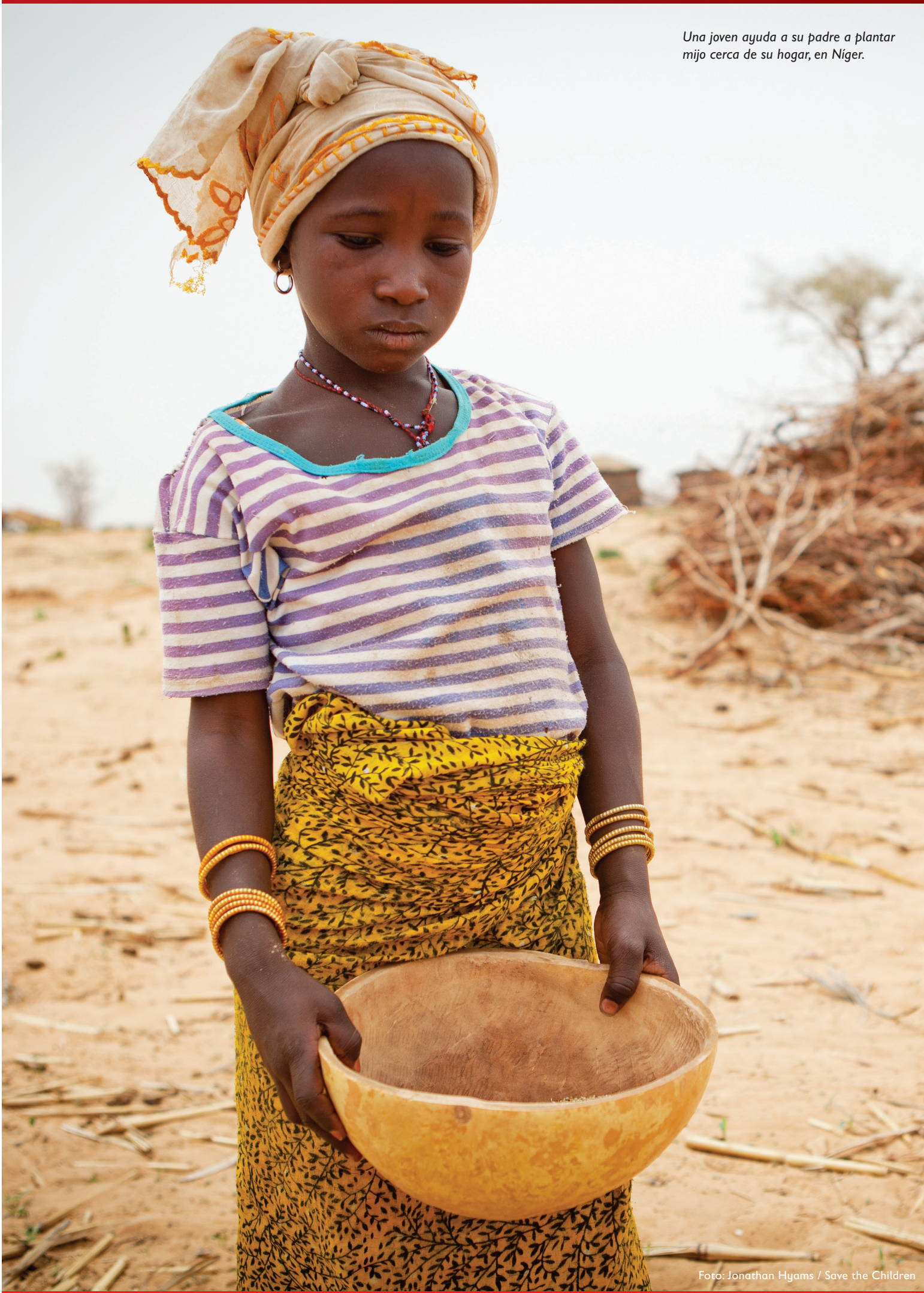
Una joven ayuda a su padre a plantar mijo cerca de su hogar, en Níger.