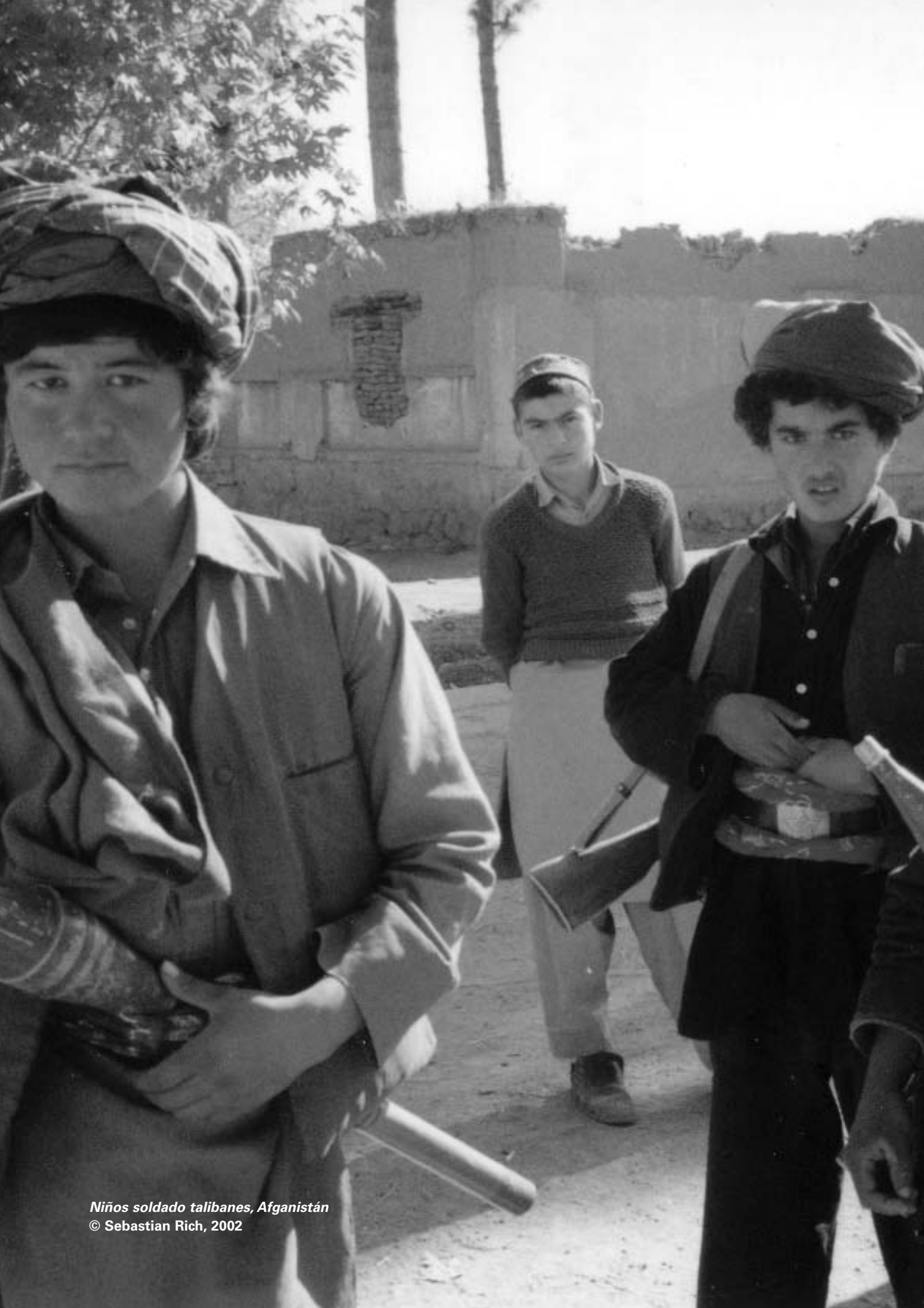
Niños soldado talibanes, Afganistán