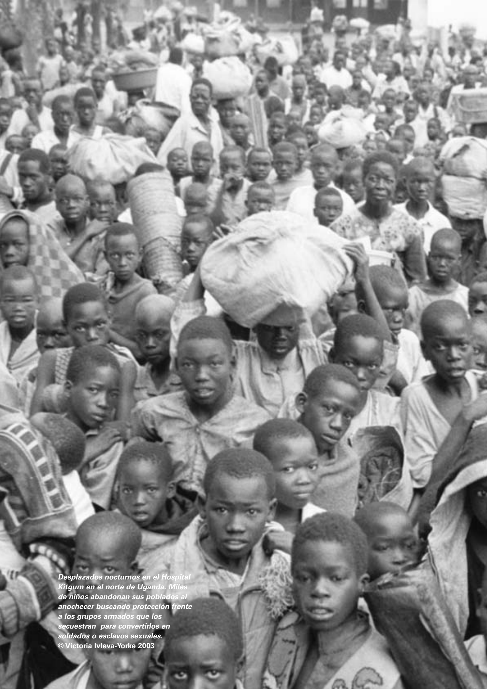
Desplazados nocturnos en el Hospital Kitgum en el norte de Uganda. Miles de niños abandonan sus poblados al anochecer buscando protección frente a los grupos armados que los secuestran para convertirlos en soldados o esclavos sexuales.