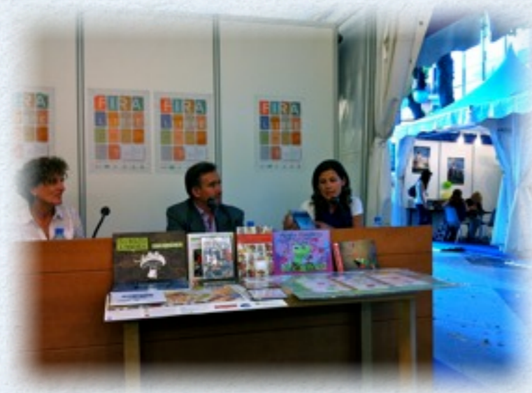
Presentación material didáctico en la Feria del Libro de Palma.