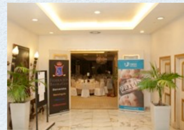
La federación Balear d eGolf organizó una cena a beneficio de RANA.