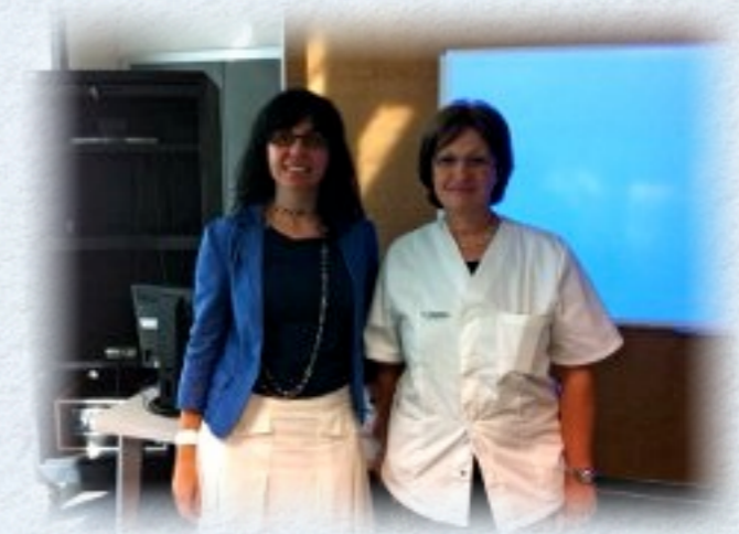
Presentación de RANA a los residentes de psiquiatría y psicología de Son Espases.