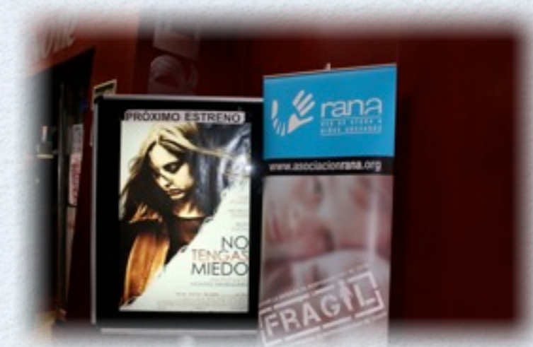
RANA en la presentación de la película "No tengas miedo", en cines Renoir de Palma.