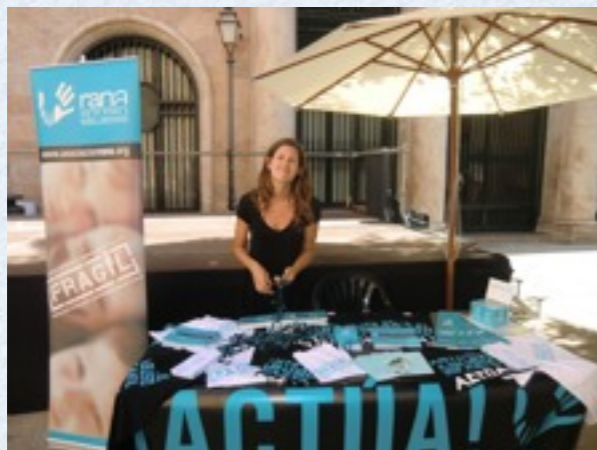
En las Fiestas de la patrona de Palma.