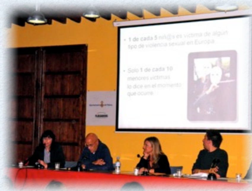
Mesa redonda "Infancia y Derechos" junto con miembros de Amnistía Internacional, Sonrisa Médica, Unicef y Feiab