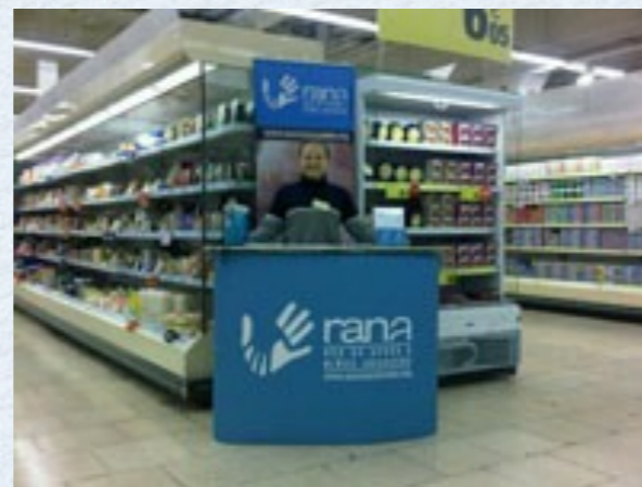
Carrefour abrió sus puertas a Rana