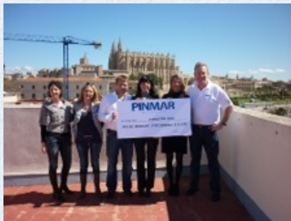
Pinmar organizó un torneo de golf para RANA.