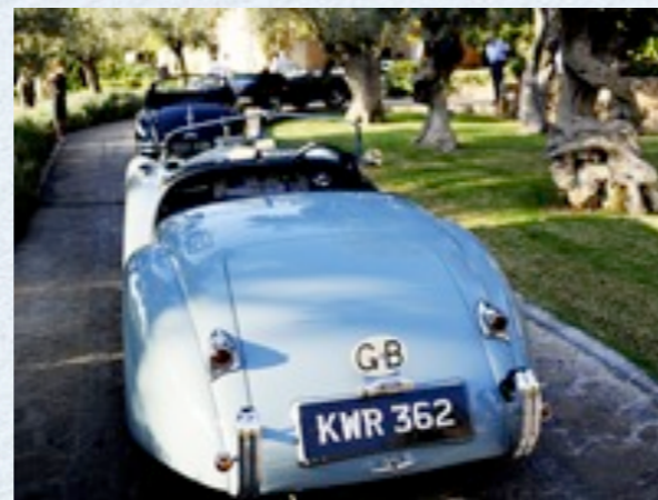
Evento solidario en el hotel La Residencia de Deiá, con el "Classic Touring Jaguar Club".