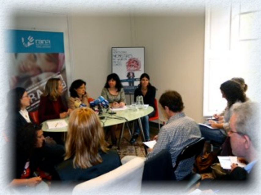
Rueda de prensa para presentar el primer estudio de prevalencia de abuso sexual infantil en universitarios de Baleares