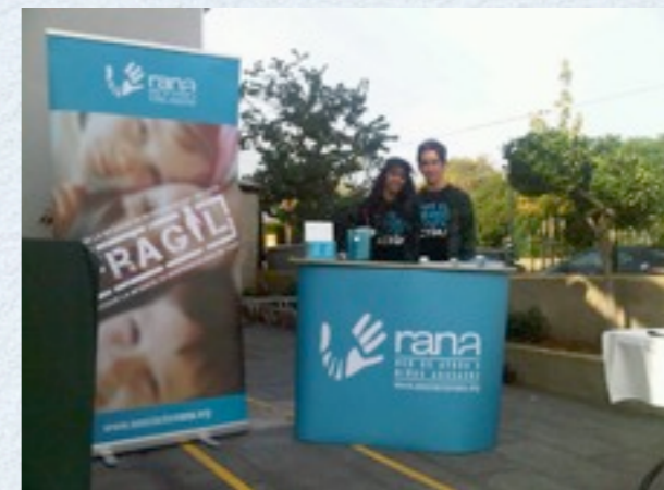
Torneo benéfico de padel TUI .