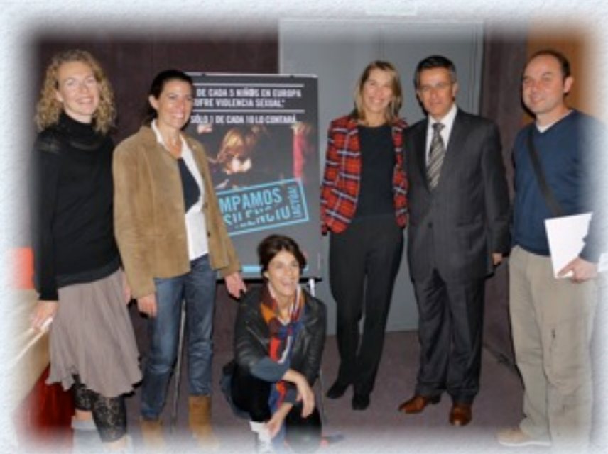
Presentamos el primer spot publicitario, para televisión y cine, de la Fundación RANA