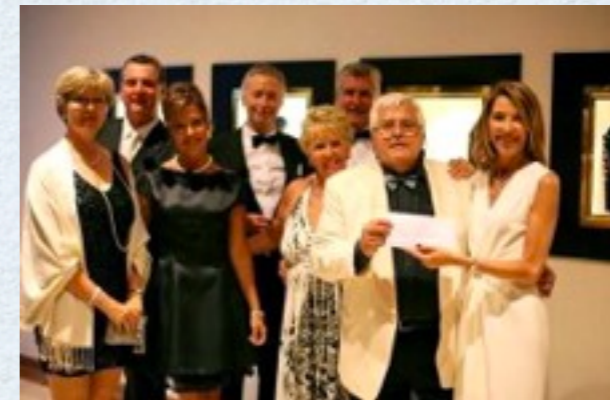
Donativo de los Rotary de Calviá entregado a RANA.