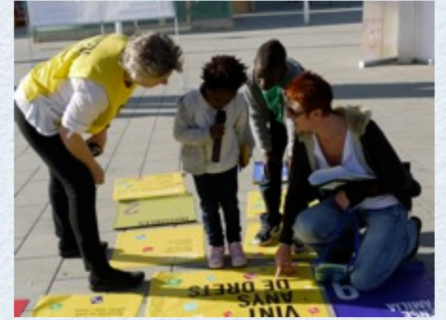
Día Internacional de la Infancia. Jornada lúdica organizada en el Parc de Ses Estacions junto a Amnistía Internacional, Sonrisa Médica y Feiab.

Agradecimientos patrocinadores y amigos hotel La Missió