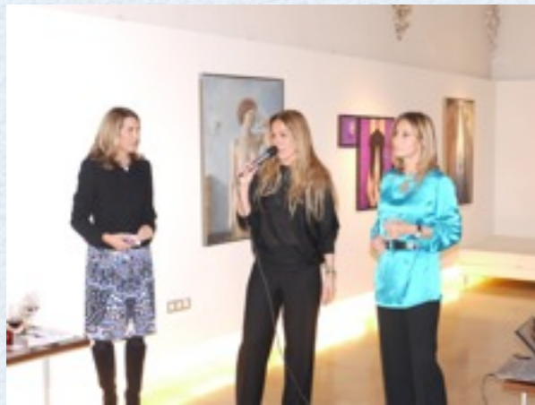
Agradecimientos a patrocinadores y amigos en el hotel La Missió.