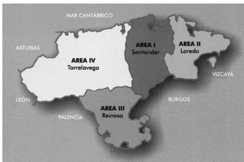
Figura 1. Áreas Sanitarias de Cantabria