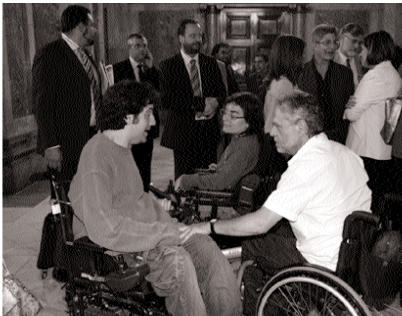
La sessió parlamentària d'aprovació de la Llei va ser seguida per nombrosos representants de les entitats socials en una sala annexa a l'hemicicle.