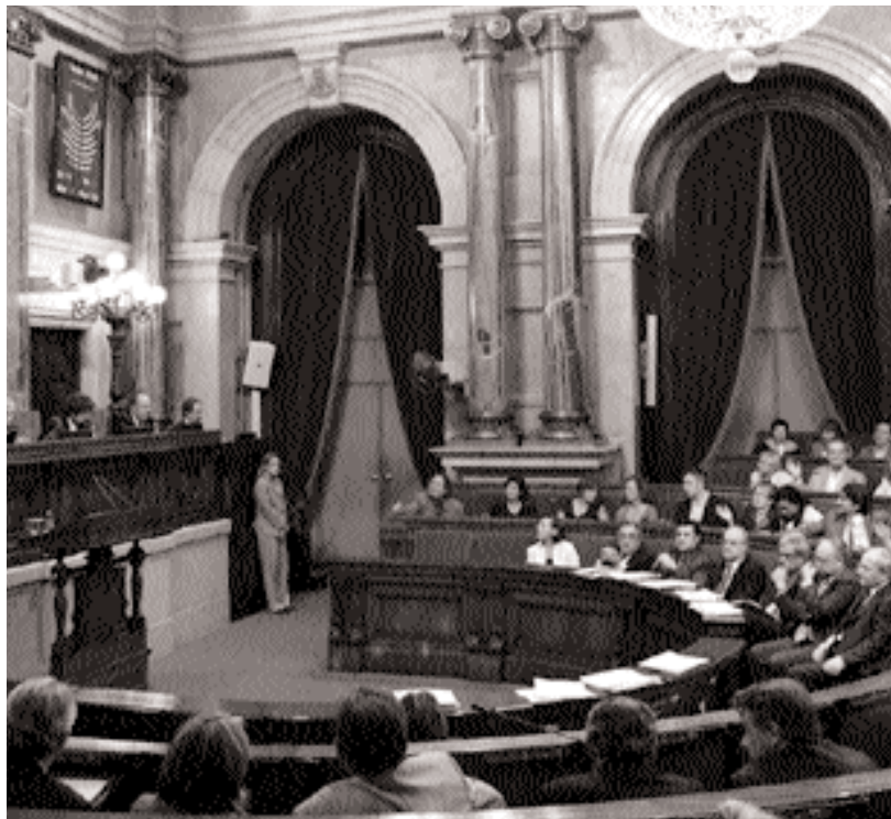
El Ple del Parlament just després d'aprovar per unanimitat la nova Llei de serveis socials.

Són titulars del dret a accedir al sistema públic de serveis