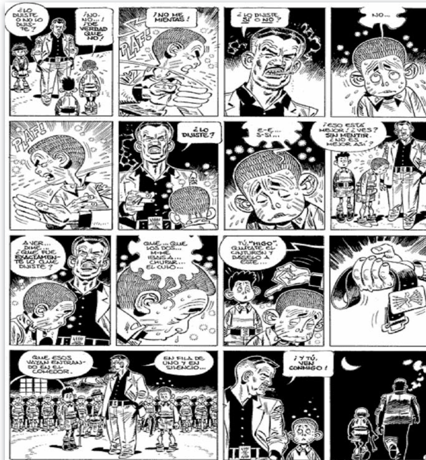
Il·lustració 3: La vida als centres de l'INAS segons Carlos Giménez.

Reproduïm aquí una pàgina amb algunes de les seves vinyetes, que donen una idea de l'escenari en el qual van haver de viure tants nens i nenes de la postguerra espanyola.