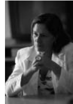
CARME CAPDEVILA I PALAU Consellera d'Acció Social i Ciutadania

d'accions encaminades a donar suport a les persones més vulnerables del nostre país. Així, entre altres accions, vull citar: el Pla de suport al 3r sector social, les mesures integrades en el Pla d'inclusió i cohesió social 2006-2009 i les que s'encabeixen dins del Pla d'inclusió i cohesió 2010-2013, així com la recent millora dels requisits d'accés a la renda mínima d'inserció.