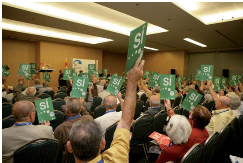
Votació a la Ponència A