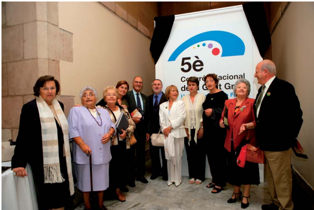
2n Ple de l'Experiència al Parlament de Catalunya. Presentació de la imatge del 5è Congrés Nacional de la Gent Gran