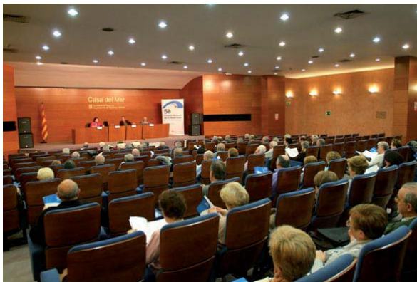
Barcelona ciutat i comarques del Barcelonès