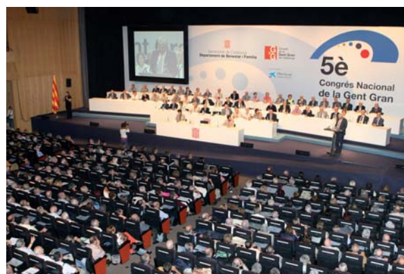
Parlament de cloenda a càrrec del Molt Hble. senyor Pasqual Maragall que fou president de la Generalitat de Catalunya