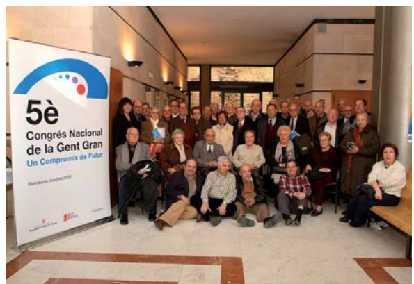
Barcelonès, Barcelona ciutat