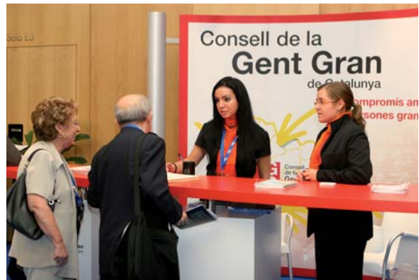
Stand del CGGCat