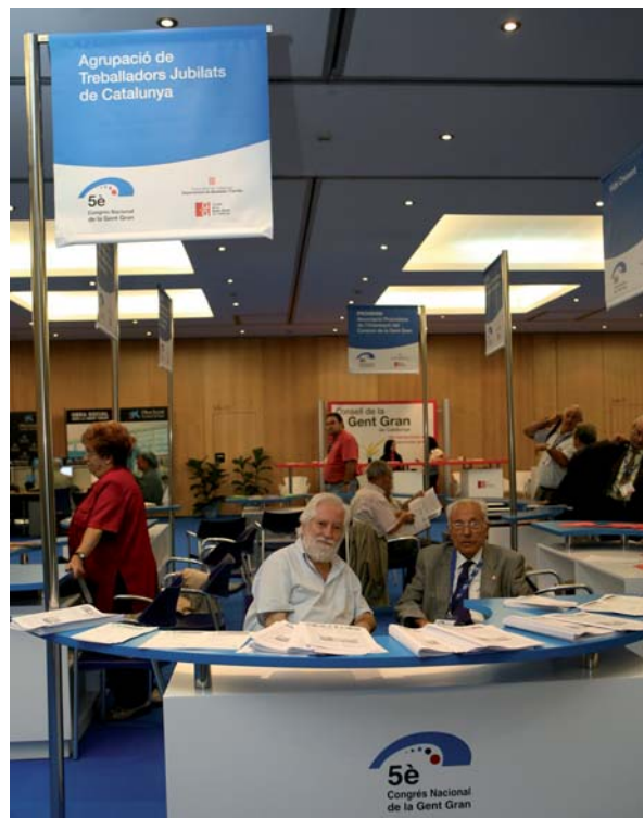
Mostra de les entitats que formen part del CGGCat