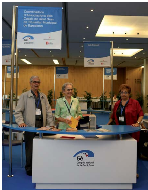
Mostra de les entitats que formen part del CGGCat