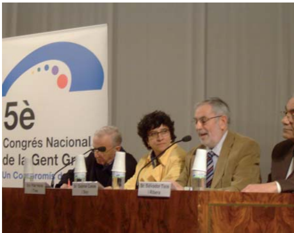
Comarques de Girona