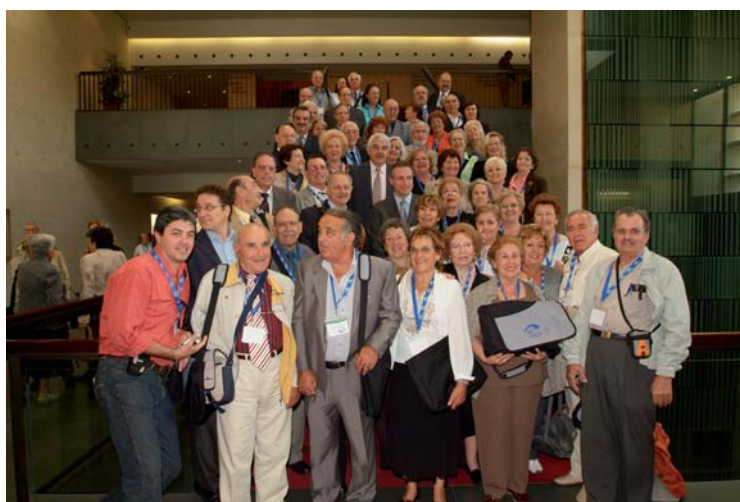
Delegats i delegades de les Comunitats Catalanes a l'exterior