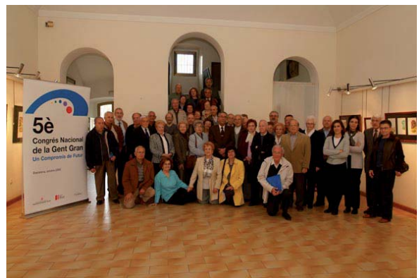
Comarques de Girona