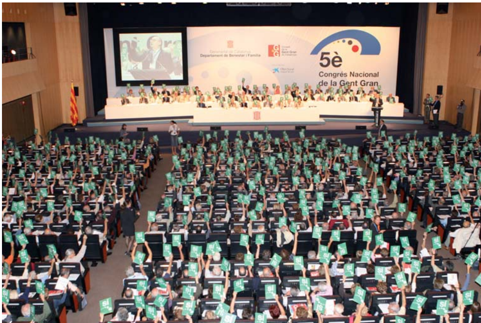
Votació en el plenari d'una esmena de la Ponència A