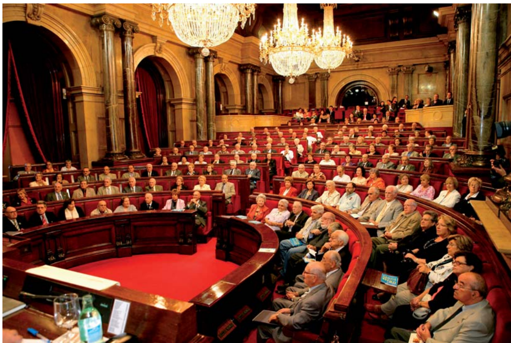
2n Ple de l'Experiència al Parlament de Catalunya: «135 escons d'experiència»