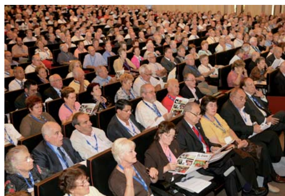
Sala del plenari. En un primer pla els representants de les Comunitats Catalanes a l'exterior