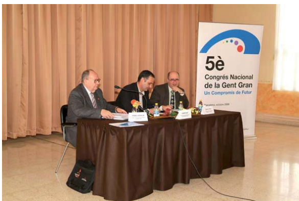
Comarques de les Terres de l'Ebre