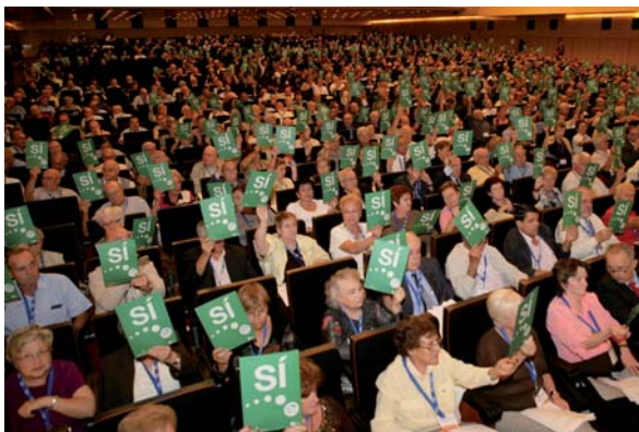
El Manifest s'aprova per unanimitat