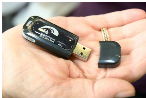
USB, pendrive o llapis de memòria que contenia les conclusions i el Manifest