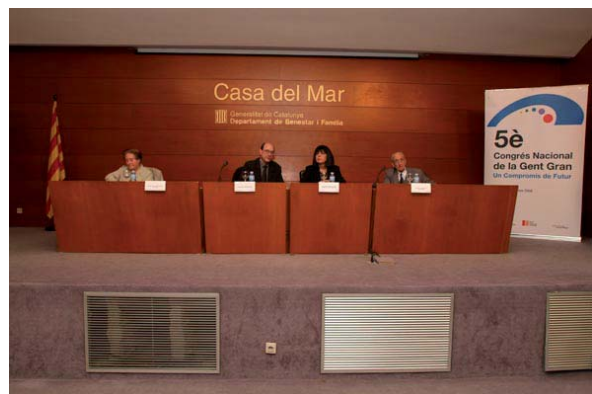
Barcelona ciutat i comarques del Barcelonès