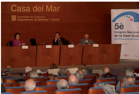
Barcelona ciutat i comarques del Barcelonès