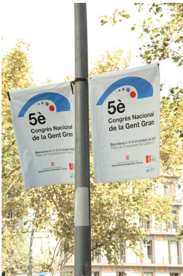
Les banderoles que anunciaven el 5è Congrés