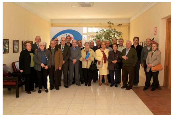
Comarques de les Terres de l'Ebre