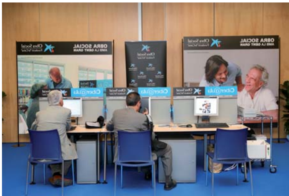
Ciber@ula de l'obra social de la Fundació "La Caixa"