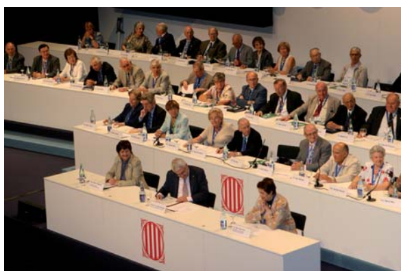
Acte de cloenda presidit pel Molt Hble. senyor Pasqual Maragall que fou president de la Generalitat de Catalunya