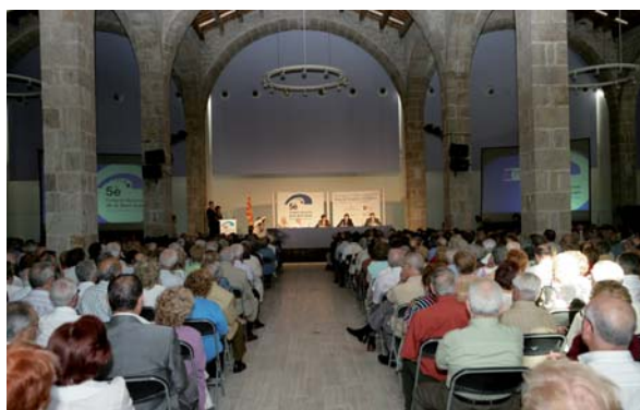
Acte de nomenament dels presidents del 5è Congrés Nacional de la Gent Gran a les Drassanes de Barcelona