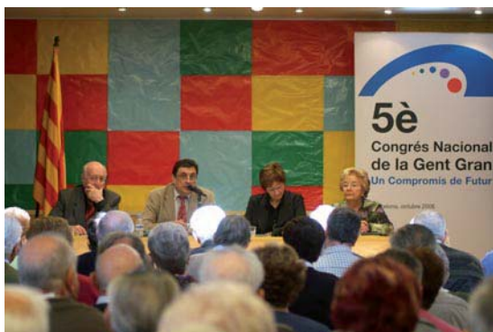
Comarques de Lleida