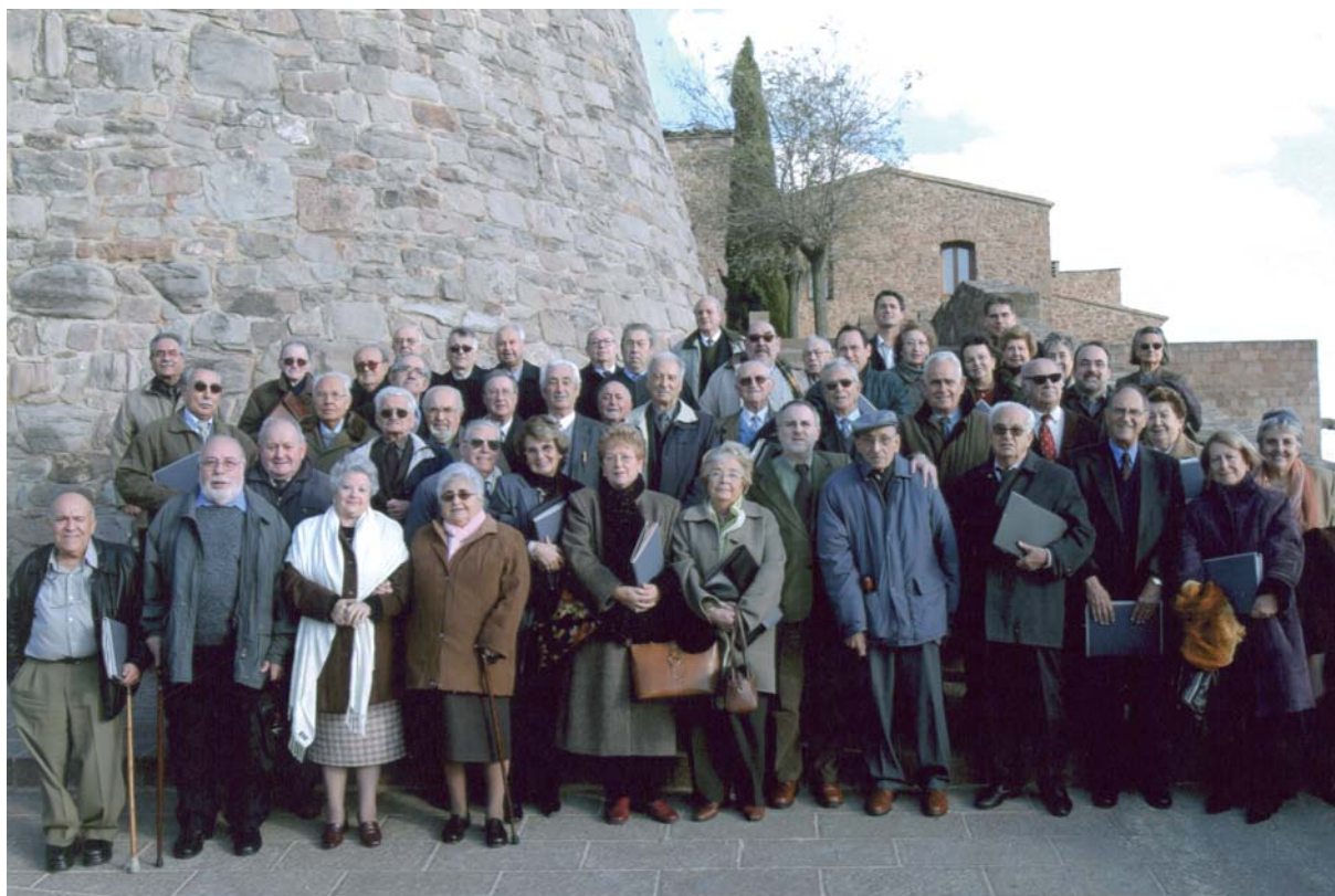
Consell de la Gent Gran de Catalunya.