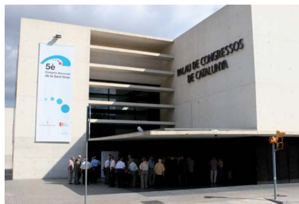
Arribada dels delegats i les delegades