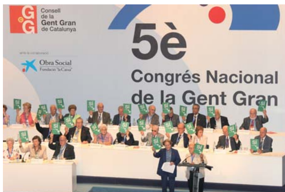
Un Sí rotund a la Ponència B