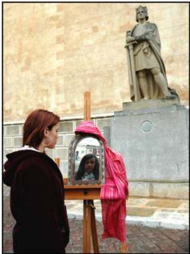
La conquesta de la igualtat Foto07