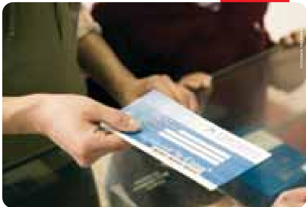
FOTOGRAFÍA: PERE PERER