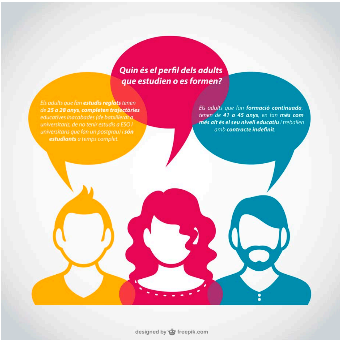
Gràfic 2. Perfil dels adults que estudien o es formen