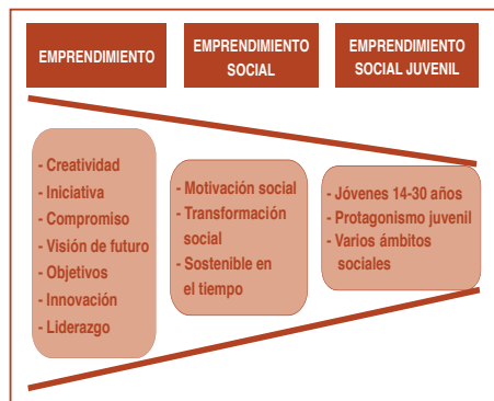
Cuadro utilizado en el seminario para introducir el concepto ESJ