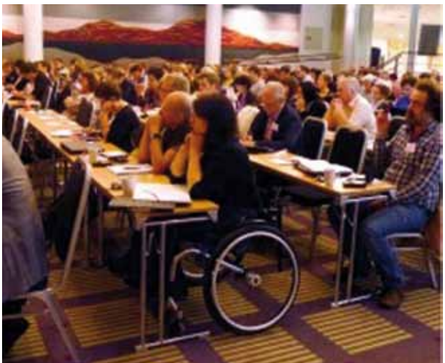
Assemblea General EAPN-Europa