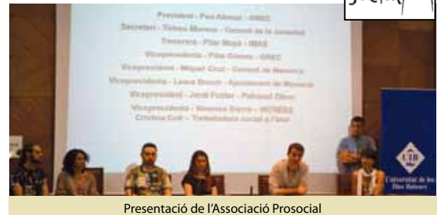
Presentació de l'Associació Prosocial

bles de la societat i millorar les condicions laborals i la praxi professional dels treballadors de l'àmbit social. Prosocial aposta per la mobilització social, la recerca d'aliances amb entitats, associacions i moviments per construir fronts comuns contra les polítiques antisocials de les administracions.