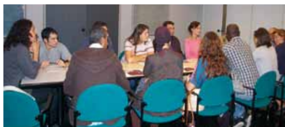
Grup de treball ocupació