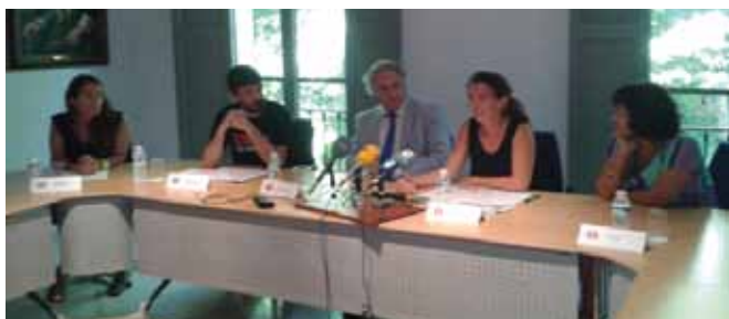
Roda de premsa per denunciar les limitacions d'accés a la sanitat

Per tal d'avançar en la derogació/modificació de del RDL 16/2012 el mes d'agost de 2012 la Xarxa creà la Plataforma en defensa de la sanitat i la llei de dependència juntament amb la Comissió de Drets Humans del Col·legi d'advocats de les Illes Balears, Metges del Món, Amnistia Internacional, i Prosocial. Es van realitzar nombroses actuacions com ara comunicats al defensor del poble i a fiscalia, demanar reunió amb el nou conseller de Sanitat Família i Benestar Social, convocatòries de premsa per a fer pressió mediàtica, etc.