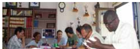
Grup de participació d'EAPN-IB