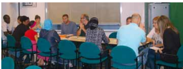
Grup de formació