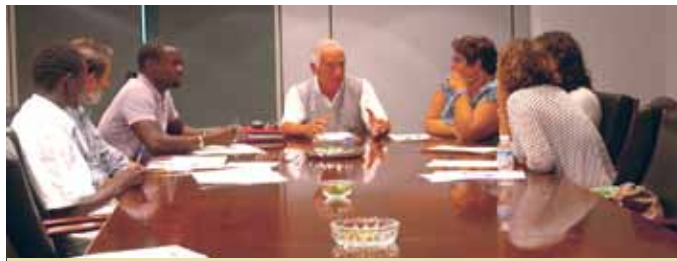
Grup de treball sanitat