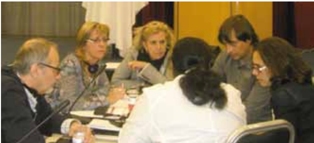
Grup de treball de l'Assemblea General EAPN-Europa