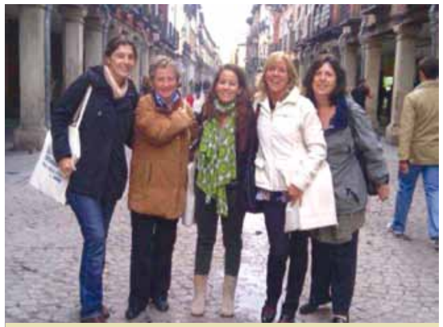
Delegació Balear a la IX Assemblea General de EAPN-ES