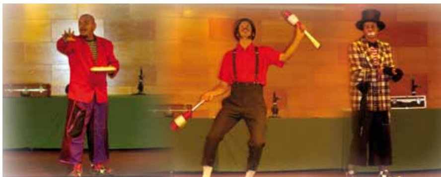
El Circ Bover va participar en la festa de la cloenda de la II Trobada