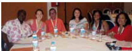
Membres del grup de participació d'EAPN-IB assistents a la VII Trobada de Participació Estatal

► El 21 de setembre es participa al Grup d'experts de pobresa i exclusió social a les Illes Balears organitzat per Creu Roja Balears.