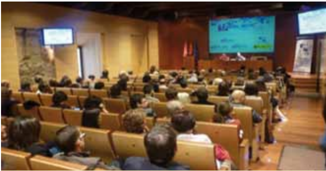
IX Assemblea General de EAPN-ES

clau que es llançaren a tot l'àmbit europeu és el titulat "L'austeritat no funciona. Ha arribat l'hora d'un pacte per la inversió social" on es defineix el posicionament de l'EAPN sobre les polítiques europees davant la crisi. (v. http://www.eapn.es/ARCHIVO/documentos/recursos/1/1162_Microsoft_Word_-_Declaracion_AG_2012_EAPN.PDF )