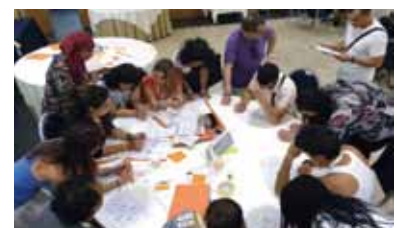
VII Trobada de Participació Estatal