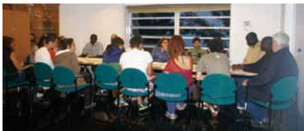
Grup de treball vivenda

Amb motiu del Dia Mundial de Lluita contra la Pobresa i l'Exclusió Social, el 17 d'octubre es va celebrar la 2a trobada de participació de persones en situació de vulnerabilitat en la seu de l'ONCE a Palma, sota el lema «Crisi i convivència, formació, ocupació, sanitat i habitatge».