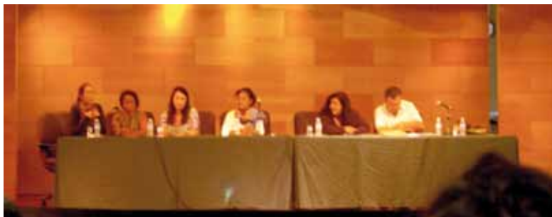
Taula rodona sobre iniciatives de participació ciutadana

Amb motiu del Dia Mundial de Lluita contra la Pobresa i l'Exclusió Social, el 17 d'octubre es va celebrar la 2a trobada de participació de persones en situació de vulnerabilitat en la seu de l'ONCE a Palma, sota el lema «Crisi i convivència, formació, ocupació, sanitat i habitatge».