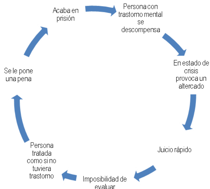
Gráfico 1. El círculo vicioso del juicio rápido para las personas con trastorno mental.

“El gran problema de los juicios rápidos es que no hay ninguna capacidad de análisis ni en policía, ni en jueces, ni en el fiscal ni en el abogado (...). No hay ninguna capacidad de evaluar. (...) Pero, ¿cómo se puede evaluar la inimputabilidad que es lo más difícil que se puede hacer, en un juzgado de guardia? Eso es imposible, con lo cual no se evalúa, con lo cual se le da el trato de normal, con lo cual se le pone una pena, con lo cual se va a la cárcel. Y es en la cárcel donde ya eso se ve y dicen pues tiene esquizofrenia. Pero ya está en la cárcel”. (Fiscal especializado en Salud Mental).