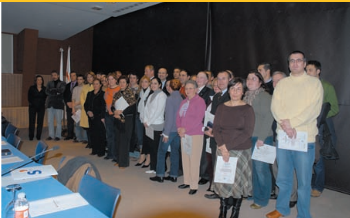
A la fotografia, tots els guardonats acompanyats de les autoritats assistents.