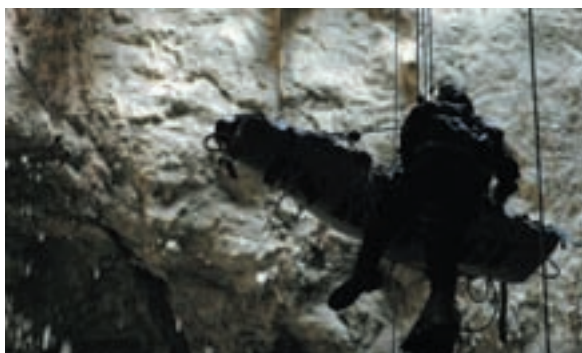
A la imatge, un moment del rescat dut a terme per l'Escola de Seguretat i Rescat de Creu Roja de Sóller.

rescat avançat. L'objectiu d'aquesta pràctica tan espectacular va ser conscienciar la població de la importància de la formació preventiva per evitar accidents, doncs cada dia es produeixen més situacions de perill a la muntanya de Mallorca degut a la falta d'experiència.