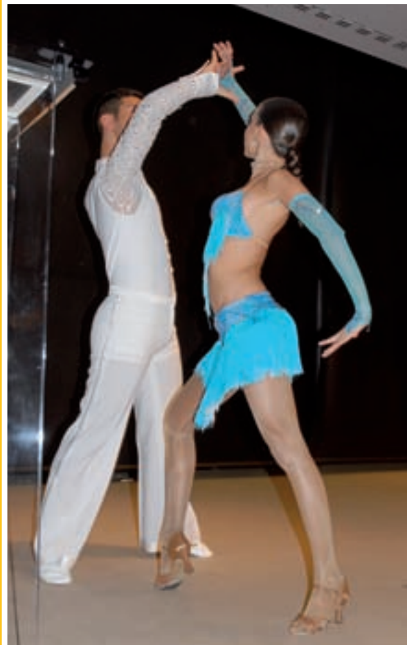
El saló d'actes de Can Domenge es va omplir de gom a gom per veure les nombroses actuacions de la festa.