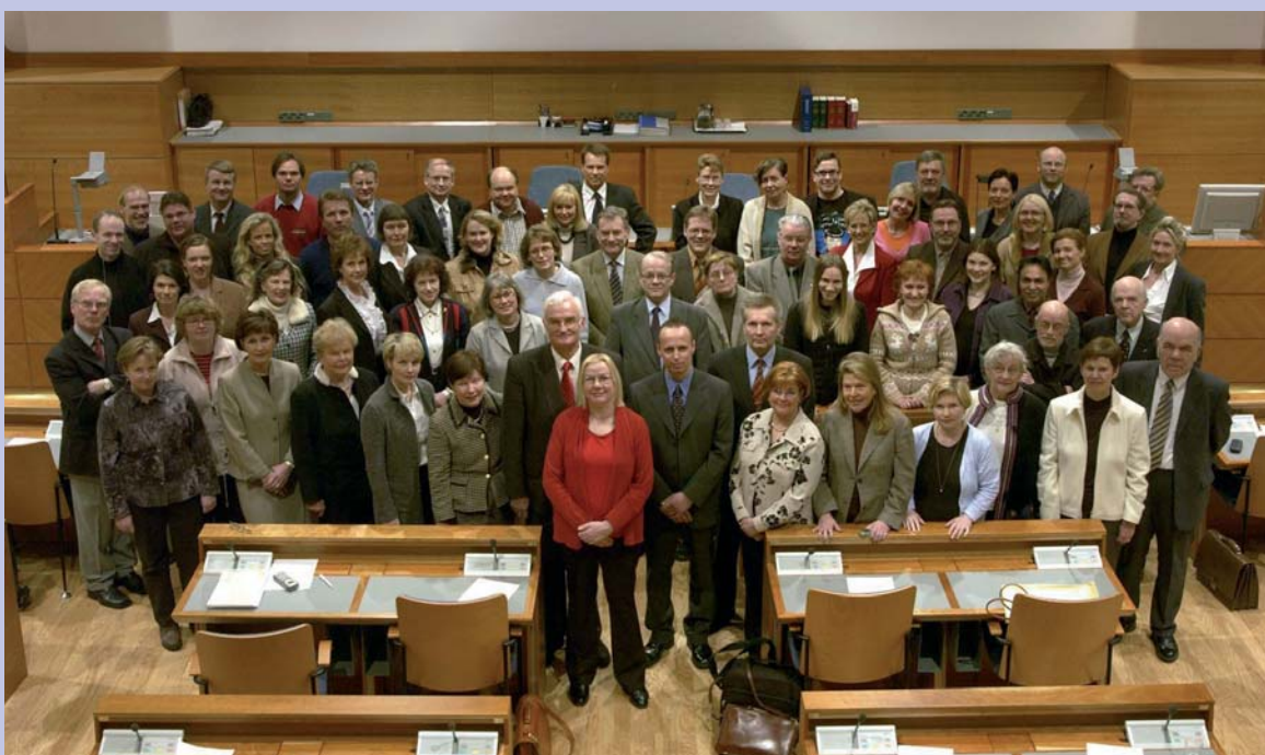
El Concejo municipal de Espoo (Finlandia): un ejemplo de asamblea paritaria.

De manera similar, las necesidades de otros grupos específicos de mujeres han de ser tratados en un marco de acción apropiado.