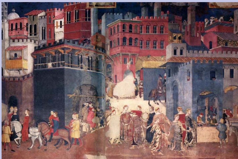
El buen gobierno, Ambrogio Lorenzetti, Siena (Italia) Palacio público (1338).