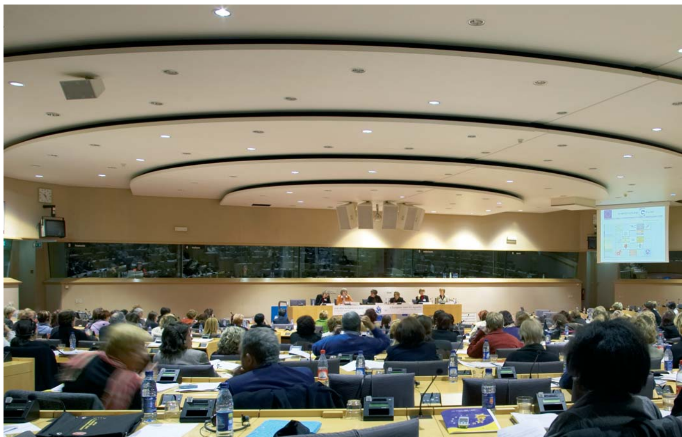
Conferencia final del proyecto "La igualdad en las ciudades de Europa". Bruselas, Parlamento europeo, febrero de 2005.

en el CMRE, con el apoyo de la Unidad Información Mujeres de la Comisión Europea, que estaba entonces dirigida por la Sra. Fausta Deshormes, quien había realizado un gran trabajo a favor de las mujeres europeas. A partir de ésta, fueron organizadas numerosas conferencias hasta la gran Conferencia de Dublín de 1995. En el seno del Concejo de Municipios y de Regiones de Europa, las mujeres electas lanzaron en ese momento un debate sobre el tema "Mujeres, Política y Democracia".