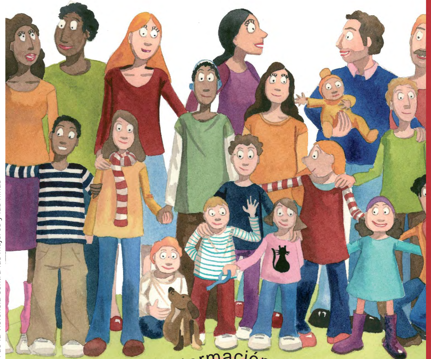
Coeducación. Prevención de la violencia contra las mujeres y las niñas