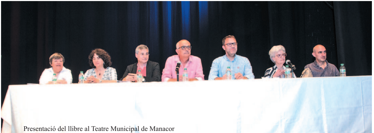
Presentació del llibre al Teatre Municipal de Manacor

talà d'Institut d'Ensenyament Secundari Mossèn Alcover; un nou centre amb vocació comarcal. Aleshores l'oferta educativa per a l'ensenyament mitjà es duia a terme a l'Institut Municipal Ramon Llull, una institució insuficient i sense possibilitat de donar el servei que requeria la ciutat de Manacor i abastar la demanda.