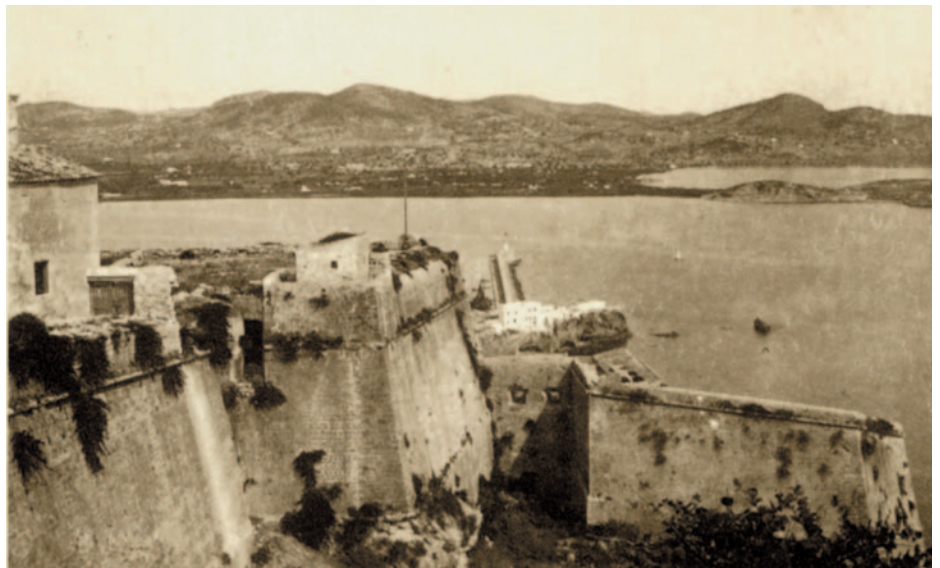
Baluard de Santa Tecla

Per tant, els eivissencs tampoc eren proclius a ajudar les tropes reials.