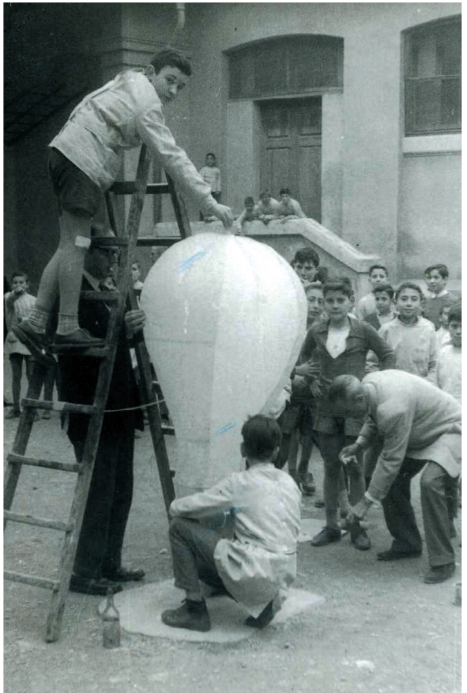
Alumnes i mestres de l'Escola de Pràctiques en el pati de l'edifici de les Avingudes. Anys seixanta.

Tradicionalment la història de l'educació ha prestat escassa atenció a aquelles dones i homes encarregats de l'activitat diària de l'escola i que eren els que realment executaven com podien, entenien o consideraven més