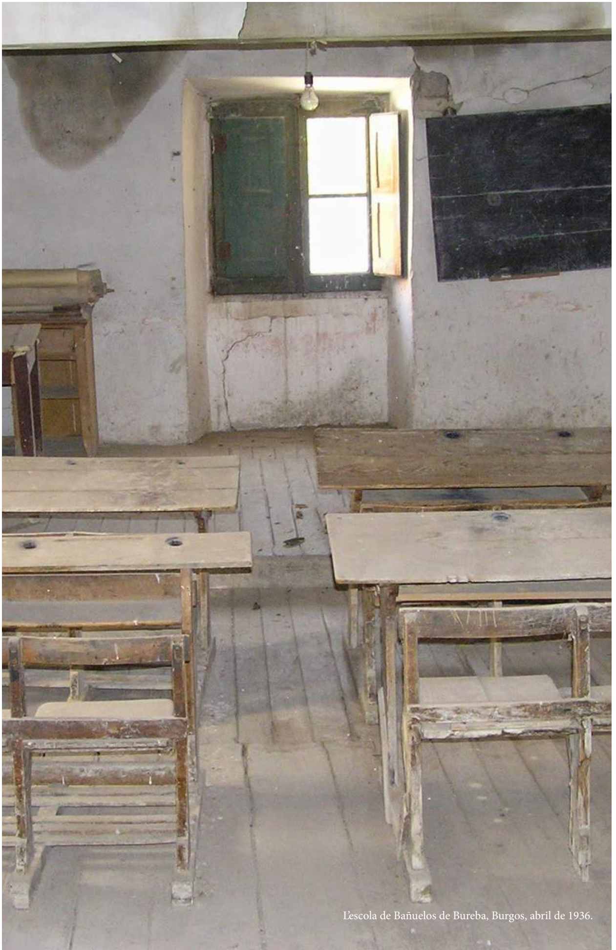
L'escuela de Bañuelos de Bureba, Burgos, abril de 1936.