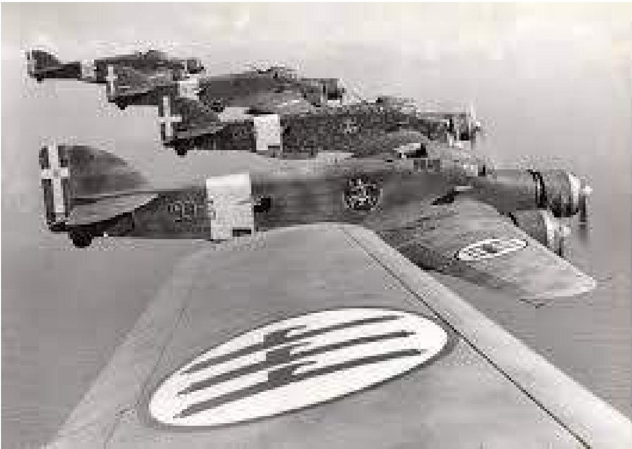
Aviació italiana, els Savoia Marchetti S. M. 79.