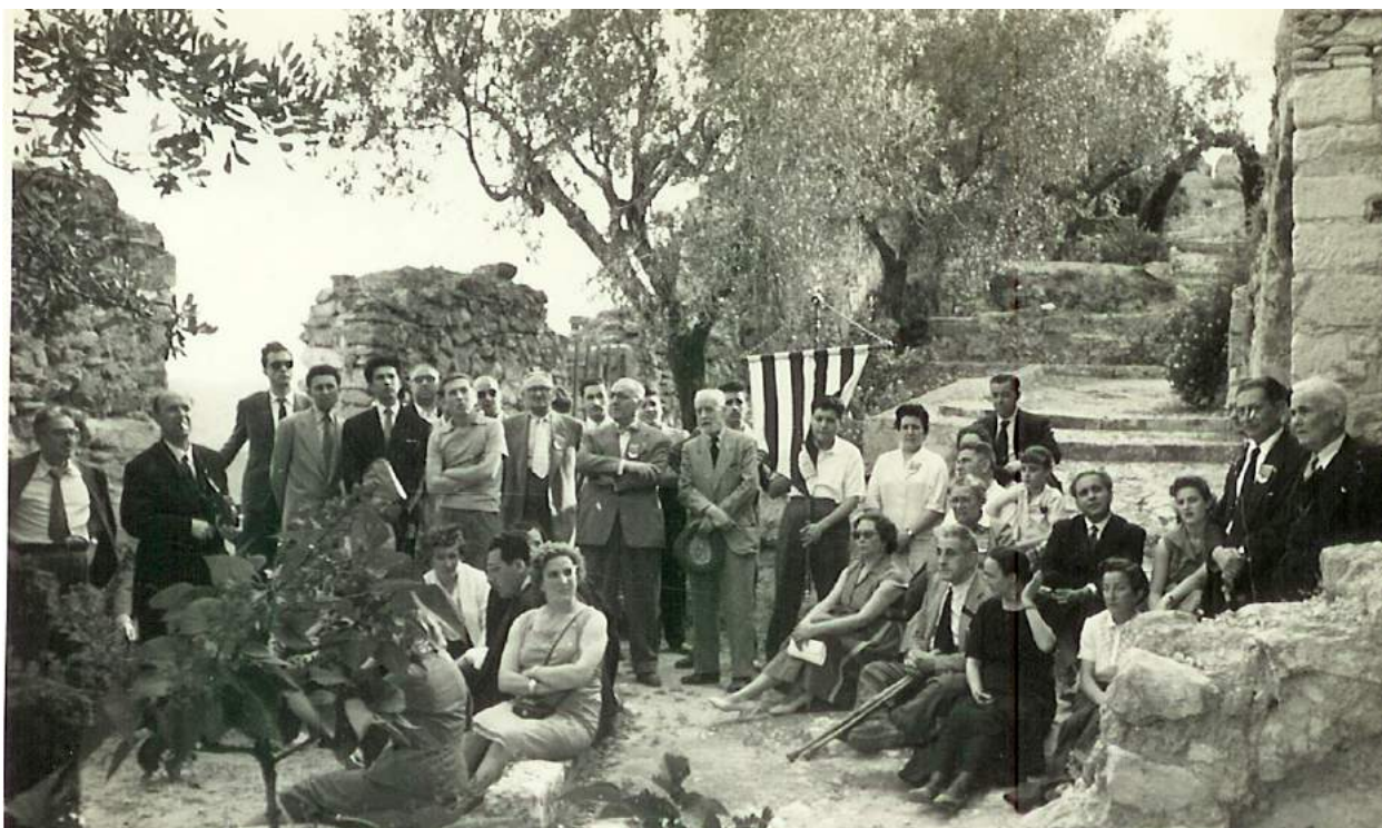
1957-Aplec de Lo Rat Penat a Xàtiva.

altra llengua s'obligarà a traduir al castellà fins els noms personals que ja existien abans de la Guerra Civil.