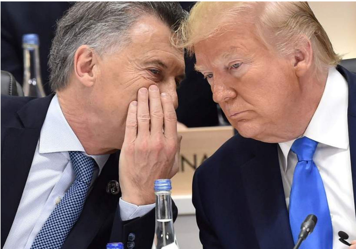
Mauricio Macri i Donald Trump.

de la majoria dels ciutadans, són perseguits, estigmatitzats, reprimits i fins i tot empresonats.