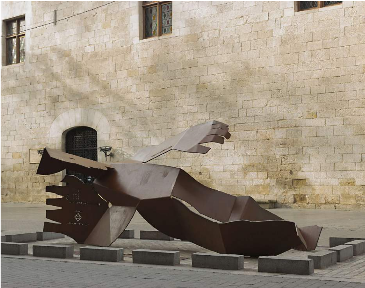
“Memòria, Dignitat i Vida” de l'escultor lleidetà Agustí Ortega a prop del lloc que ocupava l'escola.

L'entrada a l'escola era a les vuit del matí, a les nou esmorzaven, a continuació es feia una classe a l'aire lliure, d'onze a dotze gimnàstica i natació (quan feia bon temps). Després de dinar descans a la platja i a la tarda jocs i estudi a les aules, berenar i a les cinc sortida de l'escola. Els alumnes disposaven d'una barca, Nausica , amb un vigilant que feia tasques de socorrista. Aquest centre escolar municipal va publicar la revista Garbí , que recollia fins i tot estudis de meteorologia subministrats per l'Observatori Fabra, i va editar llibres adreçats als seus alumnes, com ara, L'Escola del Mar , El Llibre del Mar , a Les representacions de titelles a l'Escola del Mar , La vida social a l'Escola del Mar , etc. L'Escola del Mar fou molt valorada pels pedagogs tant del país com de l'estranger que la visitaven sovint i entre els visitants més il·lustres figuren el matemàtic Albert Einstein, que hi anà durant la seva estada a Barcelona al febrer de 1923, i el president Francesc Macià a l'estiu de 1931.