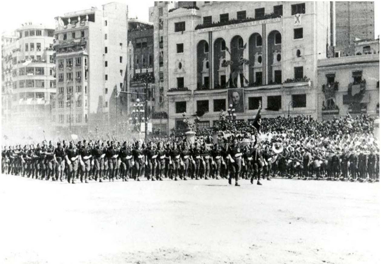
1939-Entrada tropes franquistes.

amb tots els seus mitjans l'obra modèlica de Godàs, que va haver de fer front a les nombroses crítiques i als atacs dels sectors més intolerants de la societat, que s'oposaven a la modernitat pedagògica i, sobretot, s'enfrontaven al model de laïcisme escolar. Godàs se'n va sortir i la seva escola no solament fou una fita per als lleidatans de la capital, sinó també per a moltes famílies de les comarques de ponent que feren del Liceu Escolar la seva escola.