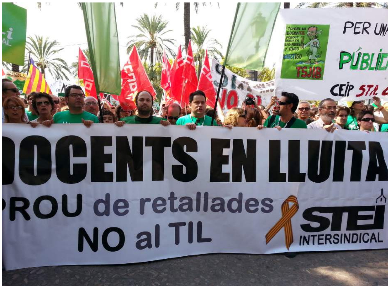
1r dia vaga indefinida concentració al Consolat 16 set 2013.

L'historiador Santiago Miró és un referent en l'estudi del tema que ens ocupa Maestros depurados en Baleares durante la guerra civil 5 i ens diu que els mestres no sabien mai de què se'ls acusava. Com que era un acte administratiu no tenien assistència jurídica. Les conseqüències foren diverses. Alguns van ser traslladats a un destí diferent dins la mateixa illa o a un nou destí a la península. Altres jubilats de forma anticipada o suspesos de sou i de feina i uns 23 mestres foren assassinats.