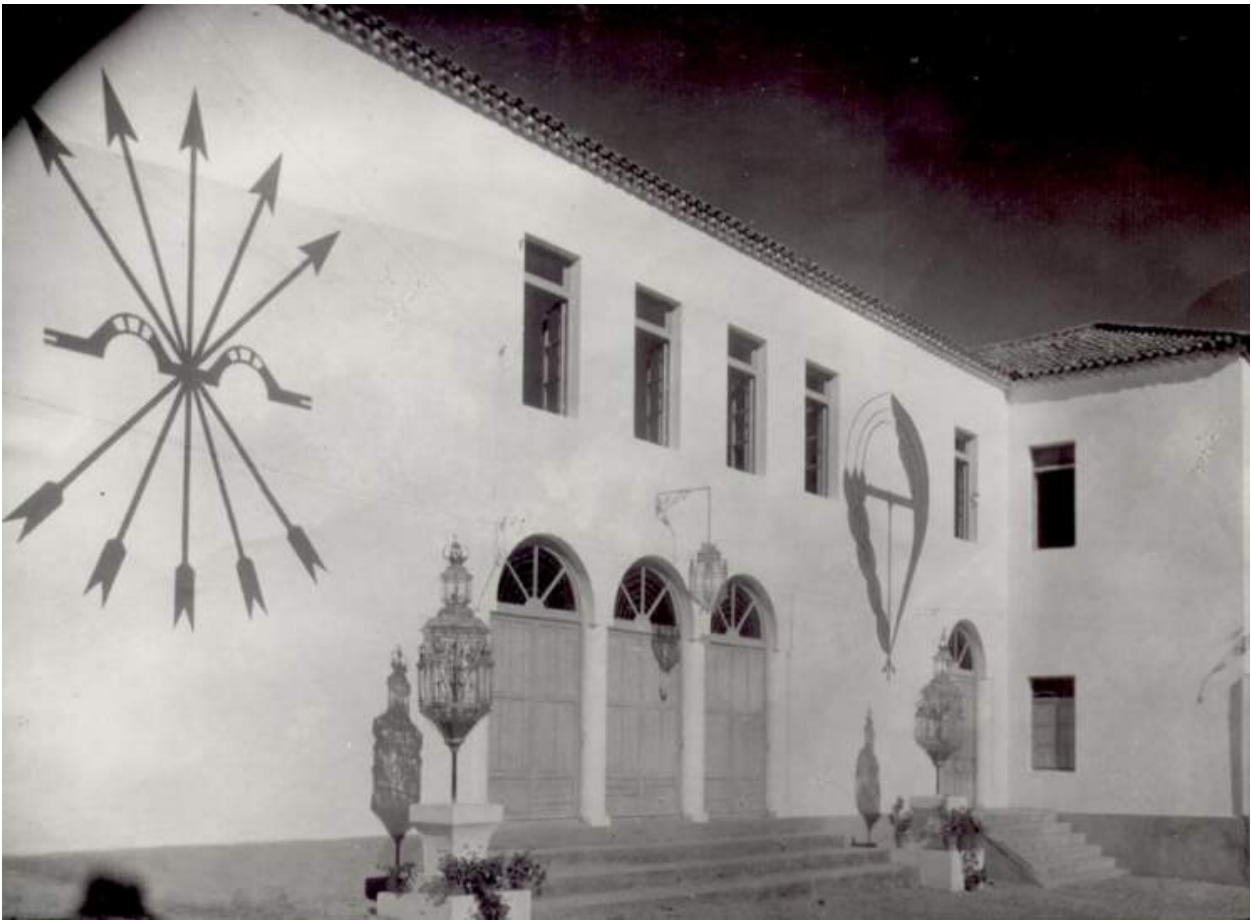
Grup Escolar Álvarez Cubero.