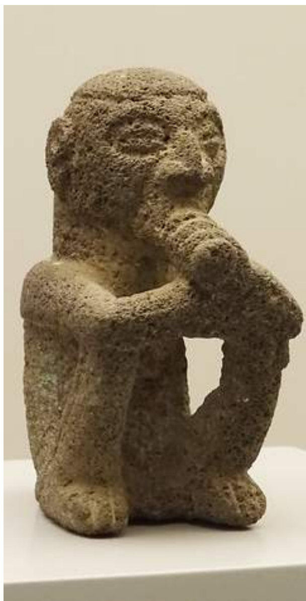
Escultura en pedra volcànica que representa un xaman.

El MEP té una mala pràctica que repercuteix en la seva labor professional i, a més, influeix en l'aprenentatge dels estudiants, com és la modificació dels