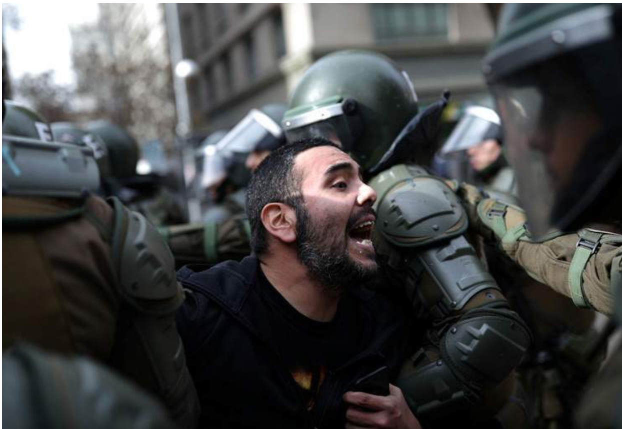
Manifestant detingut a la vaga nacional de mestres a Santiago, Chile, 20 de junio de 2019.

organitzacions arriba a constituir-se en una agenda política paral·lela a la dels governs, amb la definició d'orientacions de política nacional. D'acord amb les set trajectòries que va identificar l'estudi de la IE, "La Privatització Educativa a l'Amèrica Llatina, Cartografia de Polítiques Tendències i trajectòries", aquest conglomerat empresarial s'inscriu en les "Aliances Público Privades Històriques".