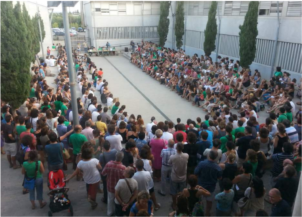
Assemblea de Docents 2013.

l'escola pública, laica, catalana, inclusiva, creativa i innovadora i a mantenir un sistema d'organització i de gestió pública. Tenim feina a no perdre la il·lusió, la creativitat, la mirada atenta, l'escolta oïda, l'afecte i l'estima per la nostra feina i els nostres infants i joves..., tenim moltes coses a salvaguardar, a promoure, a mantenir, a fer i a SER.