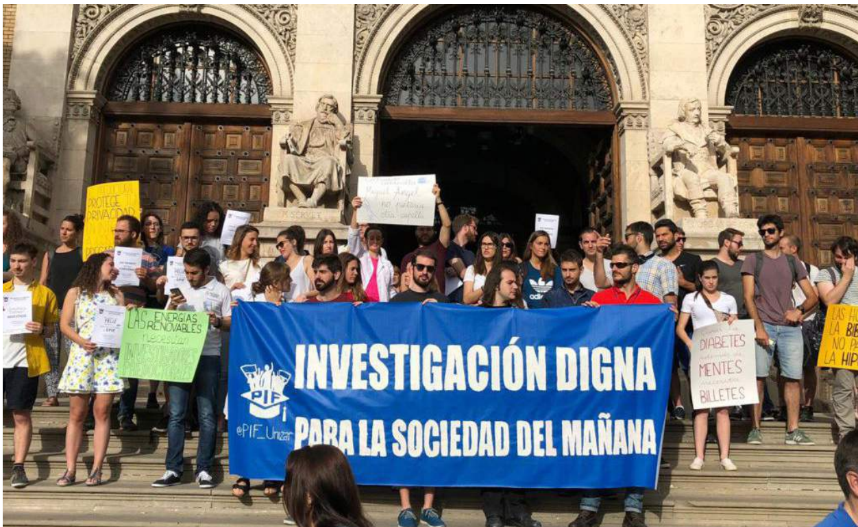
Personal Investigador en Formació PIF al Justicia de Aragón..

El professorat universitari a les universitats espanyoles es troba immers dins de diferents polítiques que condicionen el seu desenvolupament. D'una banda existeixen els condicionants pel que respecta a la seua existència com a tal, que depèn de la política de personal de cada centre, una acció poc homogènia així com en el últims anys i la taxa de reposició imposada pel Govern d'Espanya. Amb la jubilació del professorat, un sistema universitari saludable necessita una reposició, com a mínim, dels efectius amb que compta si no vol retrocedir en les quantitat i qualitat de les tasques que aquest desenvolupa. No menys important és la precarietat del personal investigador en formació (PIF) que desenvolupa una tasca fonamental al nostre sistema amb condicions laborals deficientes.