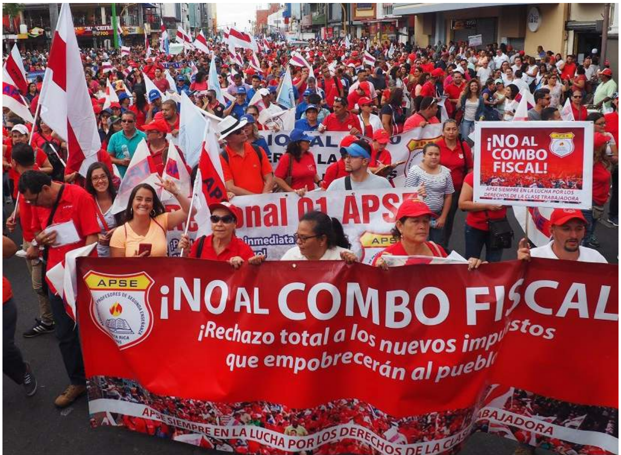
Vaga nacional enfront el Combo Fiscal projecte 20.580, 25 d'abril de 2018, San José, Costa Rica.

sures administratives atemptant a la nostra integritat familiar, laboral, emocional i psicològica.”