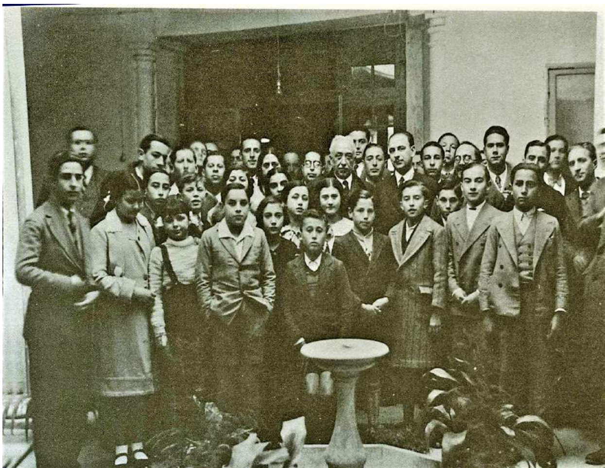
Alumnat de l'Institut de Segona Ensenyança acompanyat del President de la República.

contra la Llei de Confessions i Congregacions Religioses 11 . Simultàniament a la publicació d'aquestes pastorals, als mitjans de comunicació més conservadors es desfermava una duríssima campanya contra la República.