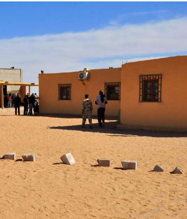
Escola saharauí d'Art. Fotografia de Valeria Saccone.

Només amb l'enfortiment del paper dels docents, la família i les institucions de la comunitat civil, associacions de pares i mares, treballadors socials en col·laboració amb les institucions públiques i l'ajuda internacional es podrà avançar per a la contribució en el desenvolupament i la promoció dels programes educatius.