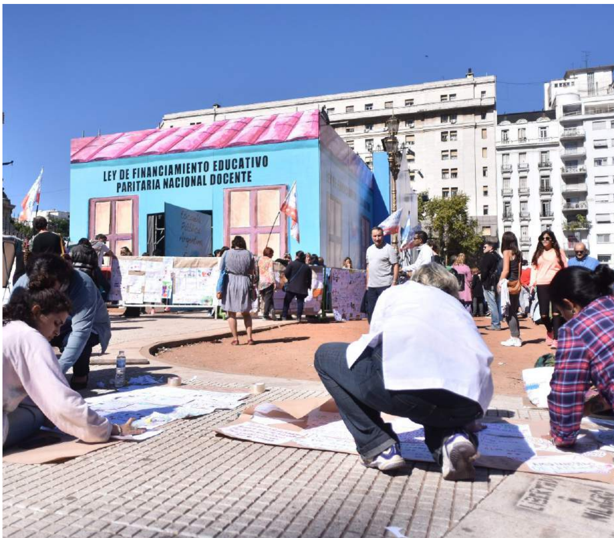
Escola itinerant instal·lada a la plaça de "los Dos Congresos".

docència i a les diverses formes de resistència organitzada que despleguen els sindicats davant l'avanç conservador i neoliberal a l'Argentina.