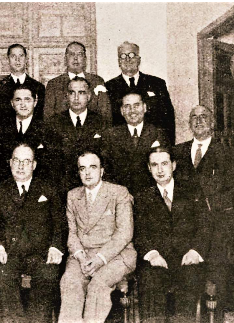
els seus companys de claustre des instituts Aguilar y Eslava i Niceto Alcalá-Zamora.

nisteri d'Instrucció Pública, publicava a la premsa madrilenya un breu article titulat "L'Escola i el Poble. Allò que farà la República", en el qual afirmava que: