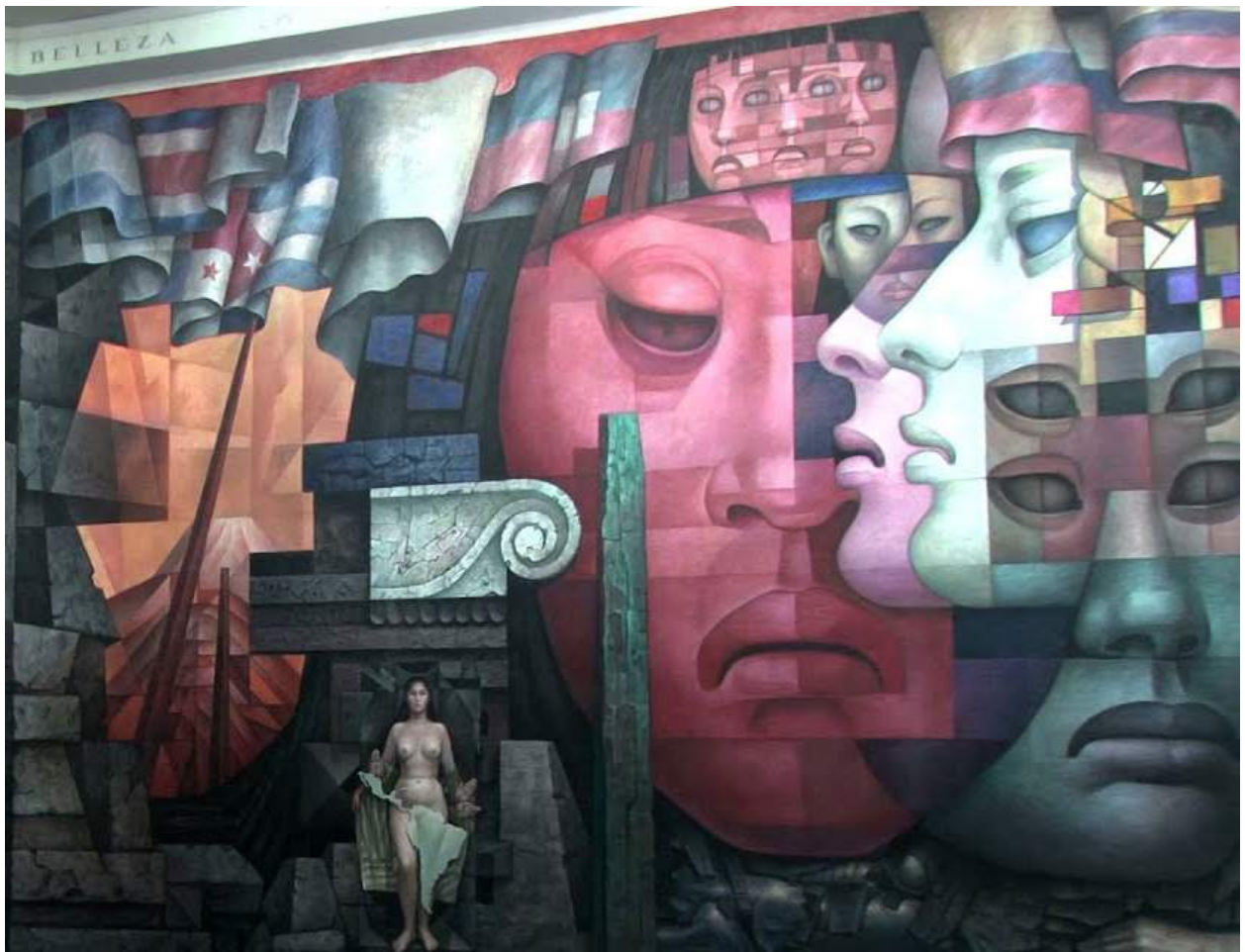
Integració d'Amèrica Latina, mural pintat per l'artista mexicana Jorge González Camarena entre novembre de 1964 i abril de 1965.

mes internacionals, com l'FMI, l'OCDE i l'OMC, torpedinen les polítiques socials i les ataquen en considerar-les com a populistes, amb el bloqueig de crèdits i la negació de préstecs. En aquesta dinàmica, la dreta recupera espais de poder formal, a través de cops d'estat, frauds electorals o amb la capitalització del descontent social. Avui es parla de necropolítica, o guerra contra els pobres. Es tracta d'abandonar-los, de deixar-los morir; no són importants en aquesta fase del neoliberalisme. Les grans migracions que avui sacsegen la regió, sobretot a Centreamèrica, amb famílies senceres lliurades a la seva dissort sense feina, sense una opció de futur, abandonen els seus països per no morir d'un tret o d'inanició.