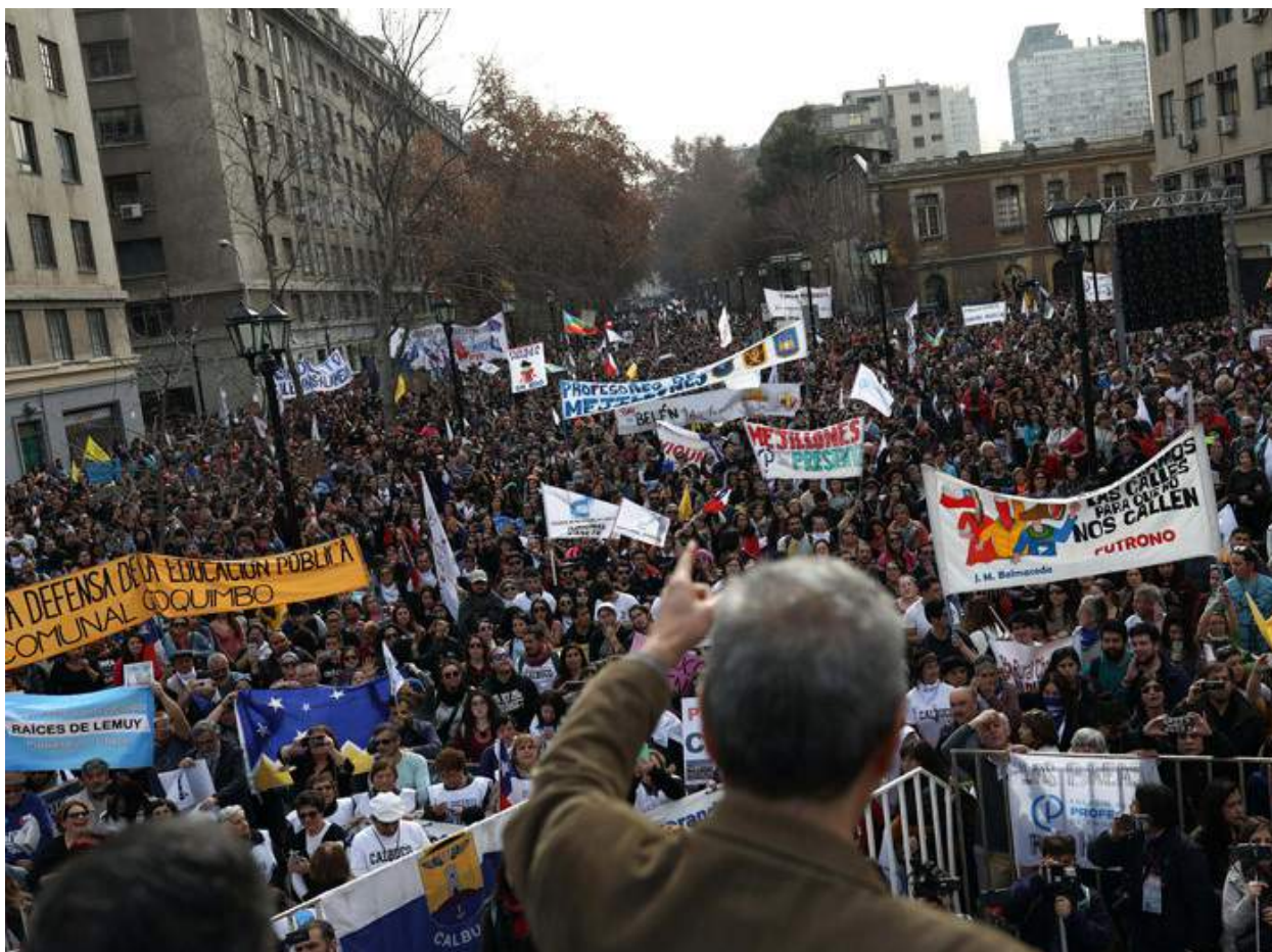
Vaga nacional de mestres, a Santiago de Xile, 20 de juny de 2019.

cionats. Actualment aquest sector posseeix prop del 70% de la matrícula escolar; malgrat això, és consens majoritari que Xile té greus problemes de qualitat educativa. El mateix Simce, indicador de mercat del model, demostra que malgrat la postergació de l'educació de propietat de l'Estat, aquesta obté millors aprenentatges de les i els estudiants (Mayol, Araya, Azócar, 2011). Com en la immensa majoria del món, la millor possibilitat d'assegurament del dret a l'educació i increment d'una educació per a la vida i de qualitat educativa integral està en l'enfortiment de l'educació pública com a referent sistèmic de qualitat. I en el cas xilè és la recuperació planificada, finançada i sistemàtica de l'educació pública, vinculada a un pla de desenvolupament nacional.