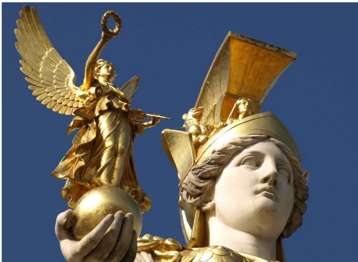
Athena filla de Zeus, deessa de la saviesa, de les arts i de l'artesania, escultura grega.

Atès que el nou professorat no te adjudicat un lloc permanent, això suposa perjudicis tant per qui és permanent en actiu, com per qui s'incorpora, amb llocs temporals i substitucions.