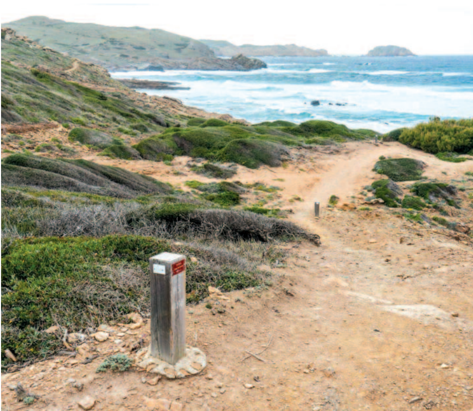
Imatge del Camí de Cavalls

Menorca va canviar el destí del seu territori gràcies en bona part a les mobilitzacions del darrer quart de segle XX. Agafar compromisos amb la sostenibilitat real de les activitats humanes cada vegada és més urgent. El futur que s'escriu dependrà d'això. ■