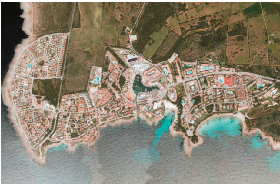
Sud de Ciutadella, després de la urbanització