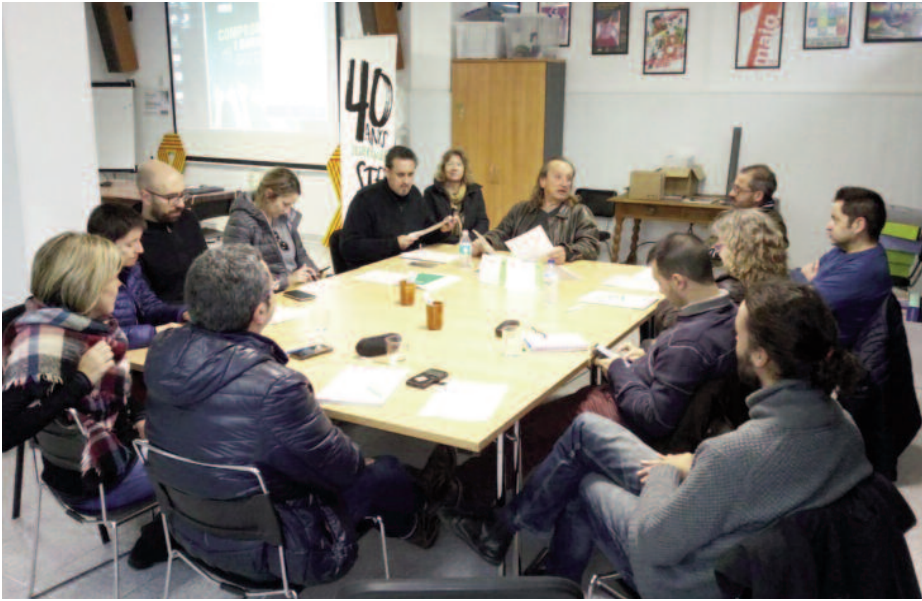
Reunió dels membres de l'STEI Intersindical de la Junta de Personal de Mallorca

rem una representació majoritària amb 11 dels 23 representants de la futura Junta. En segon lloc, per la gran participació, del 67'60%, que ha superat amb escreix la de Pitiüses i Mallorca”.