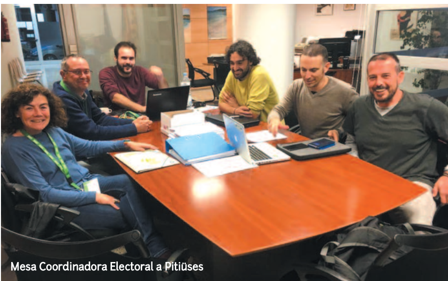
Mesa Coordinadora Electoral a Pitiüses

Uns grans resultats per a l'STEI Inter-sindical que ens encoratgen a seguir fent, amb més rigor i una major dedicació, la feina que tenim per endavant al servei de l'ensenyament i del nostre país, des de la coherència i l'ètica sindical. ■