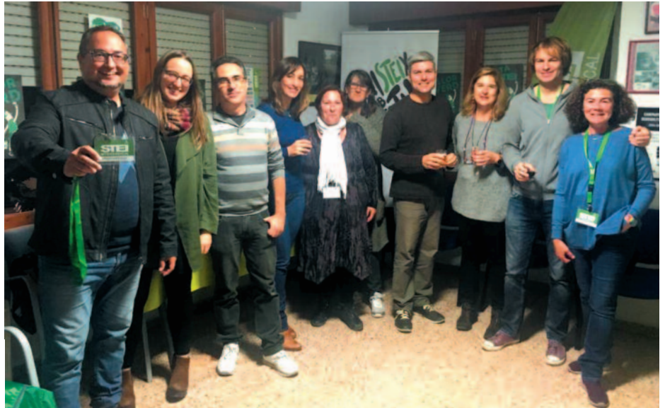
Interventors, apoderats i membres de la candidatura de l'STEI Inter-sindical a Pitiüses

“Un altre dels factors que consider que la gent ha valorat ha estat la independència de l'STEI Inter-sindical respecte de l'Administració. Vàrem saber estar al costat del Govern de Francina Armengol quan, un cop signat l'Acord marc i amb un panorama de recuperació dels drets perduts en el curt termini, desconvocàrem la vaga indefinida; però també hem estat molt crítics i bel·ligerants, durant el darrer any i mig, quan