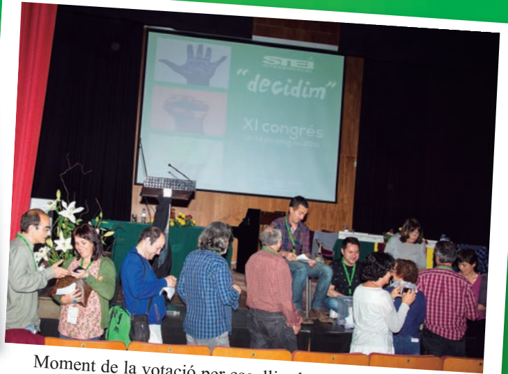
Moment de la votació per escollir els òrgans de direcció del sindicat