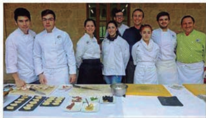
Alumnos del IES Guillem Casanoves, de Sóller, trabajaron en los aspectos culinarios de hace más de 20 siglos.