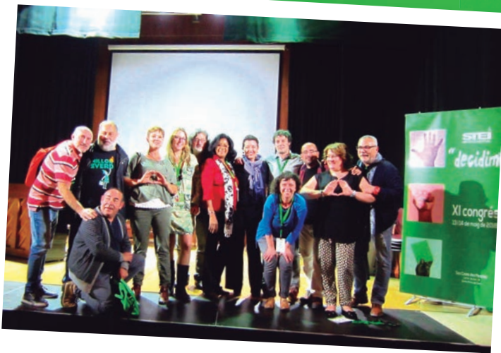
Persones convidades a l'XI Congrés