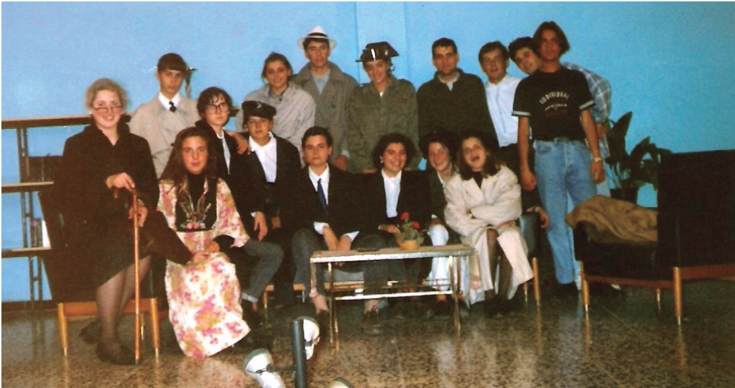
Representació al Col·legi Lladó, curs 1988-89