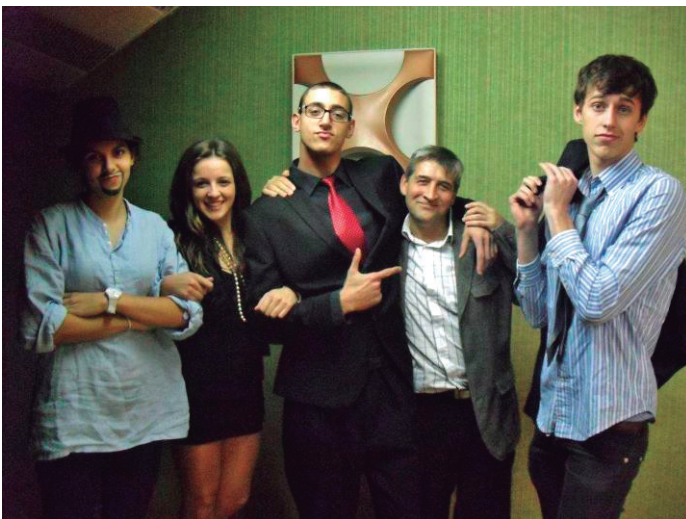
Representació de La nit de glòria d'AM a l'IES CTEIB, curs 2011-2012

posar ordre es va preocupar més per controlar els professors que els alumnes, va quedar gairebé esmicolat. Vaig patir un desencís que va anar en augment curs rere curs.