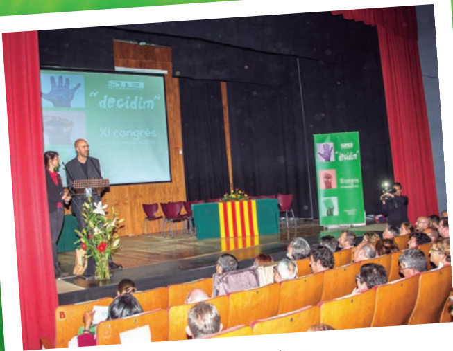
Presentació de l'acte