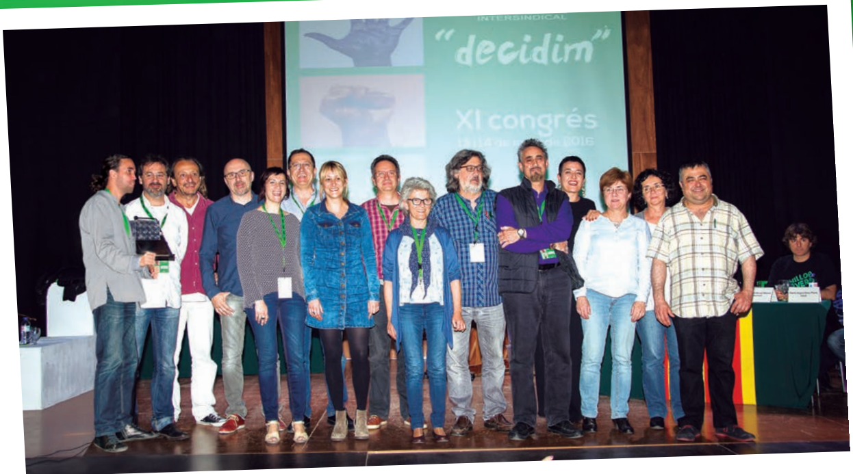
Membres de la Comissió Executiva de l'XI Congrés