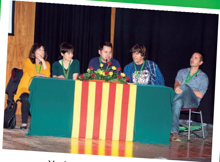
Membres de la Mesa de l'XI Congrés