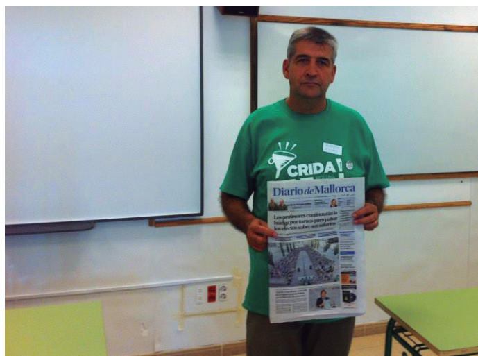
"Avui no és un dia normal". Vaga de 2013

L'any 1994 vaig incorporar-me com a interí a l'ensenyament públic. Vaig fer dos cursos a l'IB Antoni Maura. Comparat amb el centre concertat, els professors gaudíem de molta llibertat, però els alumnes eren més indisiplinats i indòcils. Em costà una mica habuitar-me. En el Maura per aquella època hi havia un laissez faire que curiosament funcionava molt bé: la directiva pràcticament no interferia en la tasca docent i l'institut, en general, navegava amb vents favorables. Tres coses em cridaren poderosament l'atenció: en el centre públic les jerarquies quedaven força difuminades, es gaudia de molts més recursos i dotació econòmica que als privats, i les eines pedagògi-