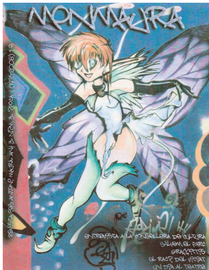
Portada de la revista Mòn Maura a l'IES Antoni Maura, curs 2007-2008

Després de l'experiència viscuda, el primer any a s'Arenal va ser balsàmic. El centre també era de nova creació i, encara que patírem haver de posar en marxa l'institut i que els alumnes resultassin fins i tot més conflictius que els de Son Servera, a mi no em va costar gaire guanyar-me el seu respecte. Vaig treballar sis anys en aquell centre. El problema fou que si a Son Servera m'havien fet trontollar l'amor per la professió, a s'Arenal amb una conflictivitat que en lloc de minvar augmentava (un curs arribàrem a tenir més de mil faltes de disciplina i una cinquantena d'alumnes expulsats), i una directiva que quan es va veure incapacitada per