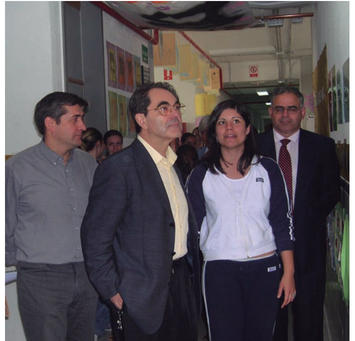
Setmana del Diccionari Alcover-Moll a l'IES s'Arenal, curs 2002-2003

en el centre. A sobre, amb l'edifici acabat de construir i completament buit, entre la directiva i alguns funcionaris de l'Ajuntament, pràcticament vàrem haver de muntar i equipar tot el centre: departaments, classes, tallers... Fou un any molt dur: més de dues hores diàries de cotxe entre anar i tornar a Ciutat, la implantació de la LOGSE, la dificultat d'iniciar la labor pedagògica a un centre nou. A sobre, els problemes d'indisciplina superaven en molt tot els que abans havia viscut i em costà força conjugar les tasques de professor amb la caporalia d'estudis que em desbordava. El curs 1998-99 vaig renunciar al càrrec directiu i, des de llavors ençà mai no m'he tornat a trobar temptat de repetir: una i oli. Fou un any trist: vaig patir un accident terrible a la carretera i vaig estar tres mesos de baixa. En reincorporar-me,