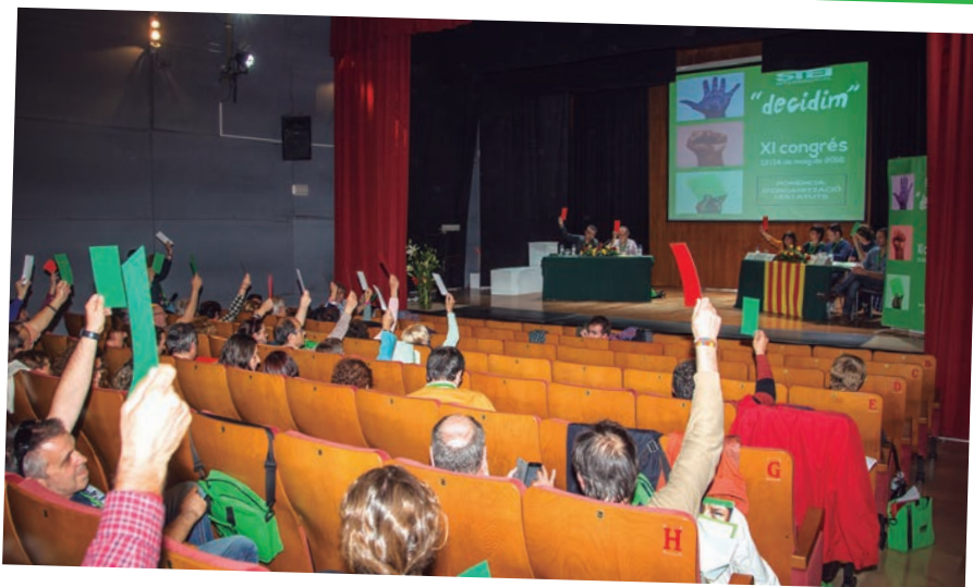
Votació a una esmena