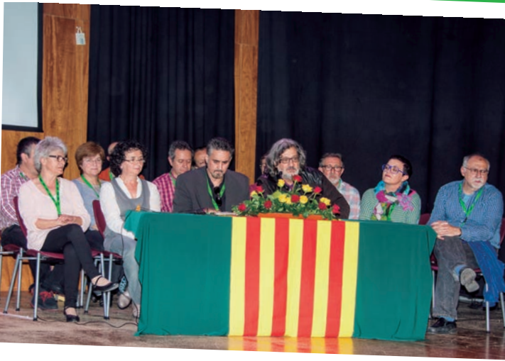
Membres de la Comissió Executiva sortint