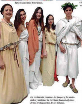
La vestimenta romana, los juegos y los misterios y mitos de escritores fueron algunos de los protagonistas de los talleres.