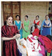
Típicos atuendos femeninos.

Mercedes Azagra