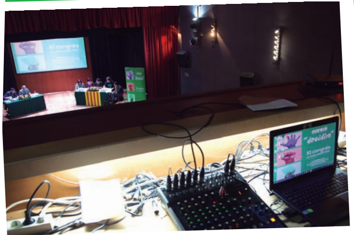
Vista de l'escenari des de la cabina de control