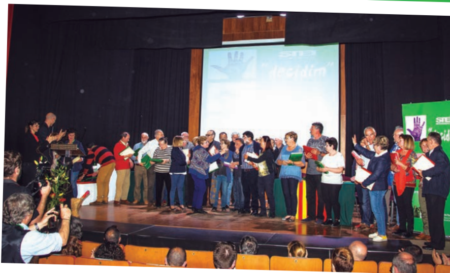
Acte de reconeixement a les persones jubilades de l'STEI INTERSINDICAL