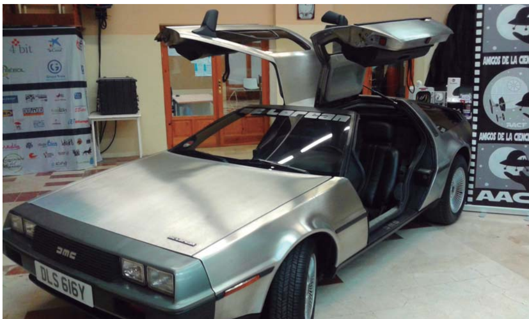
Diferents materials temàtics exposats a S'Escorxador amb motiu de la celebració del trigèsim aniversari de la nissaga estrenada a l'any 1985 (organitzat per L'Associació d'amics de la Ciència Ficcio –AACF-).