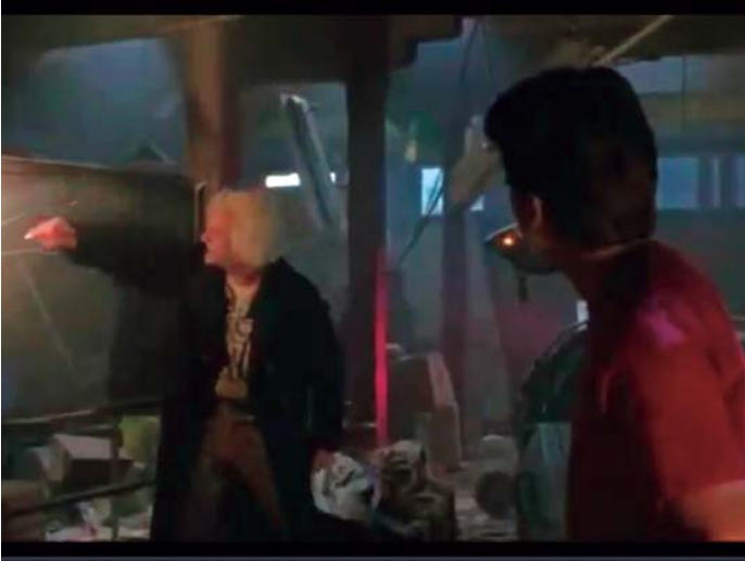
Doc Brown explica a Marty McFly els viatges en el temps mitjançant una línia temporal.

forniana). Aquests aspectes i d'altres circumstàncies van fer que la primera pel·lícula tingués un notable èxit des d'un primer moment i que el públic adolescent fos un dels seus clars seguidors (públic que actualment es troba al voltant dels 40/50 anys) i de manera simultània es rodesin les dues altres pel·lícules que completen la trilogia.