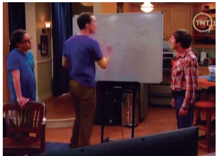
Sheldon Cooper de la sèrie Big bang theory , explica les línies temporals.

És en els darrers cursos de l'educació primària quan els infants són capaços de realitzar inferències i elaborar hipòtesis. És aquí on podem fer un ús destacat d'una eina didàctica important per explicar el pas del temps i la relació d'aquest amb tot allò que ens envolta: les línies temporals (línies cronològiques o fris històric) . Es tracta d'instruments o procediments per ordenar els esdeveniments i els fets històrics en una seqüència temporal, una representació similar a la recta numèrica en matemàtiques amb números positius i negatius a partir d'un punt determinat, és una representació gràfica del pas del temps, en què s'observen els canvis que s'han experimentat. Així l'ordenació de la informació permet l'elaboració de conclusions o explicacions sobre un procés històric. Per fer la línia del temps és important definir el contingut de la línia mitjançant un títol significatiu, determinar la primera i la darrera data del procés que es representarà, decidir les unitats de mesura que s'utilitzaran (anys, dècennis, segles...) i delimitar els centres d'interès que volem estudiar, mitjançant la seva evolució. D'aquesta manera treballarem amb les eines de la in-