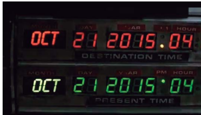
Detall interior del DeLorean amb el marcador temporal amb la data de destí (21/10/2015).

La trilogia compleix els 30 anys i els homenatges, els actes i les activitats centrades en aquest fet han estat mol-