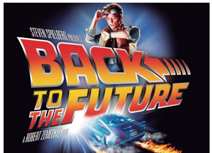
Cartell pel·lícula, any 1985.

llarga, com a petita mostra: “El tiempo en sus manos” (1960) o la seva versió més moderna “La máquina del tiempo” (2002), “Atrapado en el tiempo -Groundhog Day” (1993), “¡Qué bello es vivir!” (1946), “Frequency” (2000), “El sonido del trueno” (2005), “Family Man” (2000), “Interstellar” (2014); així com sèries de televisió: la mítica sèrie “Star Trek”, o la sèrie espanyola “El ministerio del tiempo” (RTVE-2015). “Retorn al futur” va tenir, ja a la seva estrena, una gran acceptació i tal volta un dels encerts fou el fet de mesclar la línia històrica personal i familiar del protagonista amb la línia temporal de l’evolució de la localitat i dels seus habitants (Hill Valley, ciutat fictícia cali-