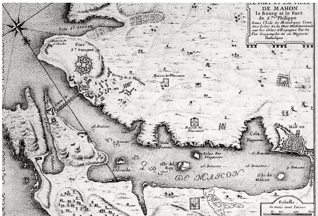
Mapa del port de Maó, al començament del segle XVIII

H i ha episodis de la història de Menorca que ultrapassen el caràcter merament insular per incardinar-se en la història general. Un d'aquests episodis és la Guerra de Successió, un conflicte per a la comprensió del qual cal tenir en compte el seu doble vessant de guerra per l'hegemonia a Europa, d'una banda, i de conflicte civil i dinàstic dins els regnes de la monarquia hispànica, d'altra banda. I l'episodi menorquí de la guerra de Successió té unes clares connotacions europees arran, sobretot, de la posició estratègica de Menorca i l'interès que l'illa suscitava tant a Anglaterra com a França.