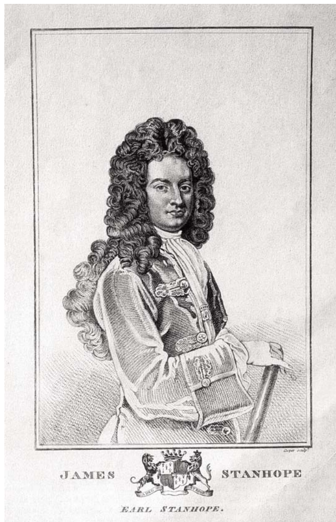
Retrat del general James Stanhope

El 6 de gener, de bon matí, les tropes borbòniques ocuparen Maó. L'endemà, els jurats d'Alaior i des Mercadal juraven fidelitat a Felip V després de veure's amenaçats amb el sacrifici dels ramats i la destrucció dels sembrats i pastures. Aleshores la resistència austracista ja s'havia esfondrat: el castell de Sant Antoni de Fornells havia es-