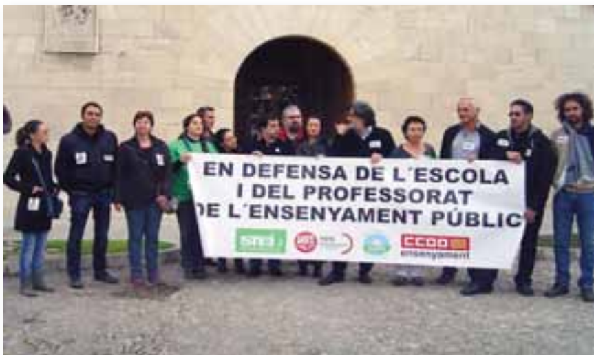
Concentració de la Junta de personal docent davant el Consolat de la Mar, el 12 de desembre de 2012.

Es fa palesa la voluntat d’atacar el model d’escola inclusiva i en català per part del govern autonòmic: s’han produït anuncis de canvis a la llei de normalització lingüística, la modificació del decret que regula un mínim del 50% en català a l’ensenyament i que encara no es compleix a alguns centres. La lliure elecció de