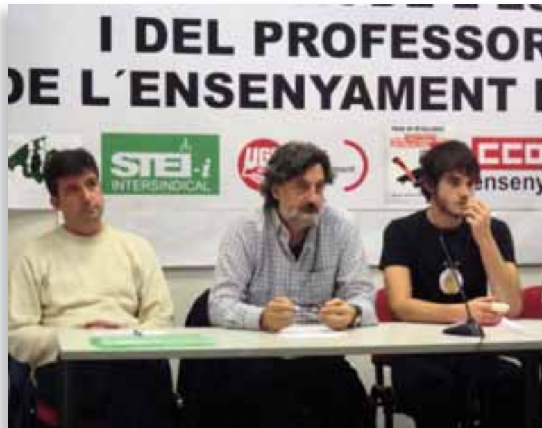
Roda de premsa STEI-i, FAPA, FETE-UGT, CCOO, FADAE.

El pressupost educatiu global de l'Estat espanyol s'ha reduït, segons dades del ministeri, en 2.200 milions d'euros, tot i que la xifra global d'alumnat i de professorat a l'Estat ha pujat. Si la cultura política del PP