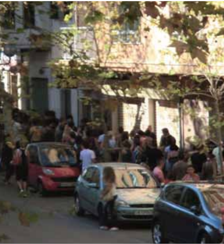
Ciutadans i ciutadanes fent cua per matricular-se a un centre d'adults.

d'educació en el pressupost general el 2010 representava el 24,3%, ara està previst el 20,88% per sota del 21,19% destinat a pagar deute.