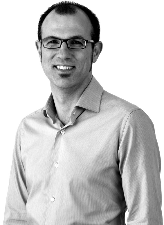
Biel Barceló, candidat de la coalició PSM-Iniciativa Verds-Entesa

Una de les conseqüències de l'acció, o inacció, del govern socialista ha estat la pèrdua del poder adquisitiu no sols dels treballadors de l'ensenyament sinó de tots els ciutadans, petits empresaris, treballadors i funcionaris. Evidentment és una conseqüència inherent al concepte antiquat que té el model socialista de la societat actual, i no pot enfocar-se com un fet que es pugui separar de la filosofia i pràctica política. Ells retalls salarials i la congelació de sous produïts, amb el consentiment tàcit dels sindicats, han de ser recuperats per via política. Els períodes de govern del partit popular, com tots sabem, sempre han suposat per als ciutadans unes èpoques de benestar i millora de la qualitat de vida. Si a les properes eleccions es produeix el canvi desitjat pels ciutadans, treballarem per retornar el poder adquisitiu al professorat i a la resta dels ciutadans.