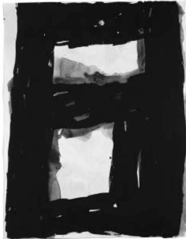
R. Canet. Sense títol 2003. Viníllica sobre paper 146 x 114 cm.

imaginar-nos una ruta literària per fer fora de l'aula. O també podem seleccionar uns determinats llocs literaris dels que referenciaré més endavant i incrustar-hi tot de fragments de diferents obres (novel·les, assaigs, contes...) que hi lliguin perfectament. Qualsevol ruta pot invitar a l'aventura, però especialment si prenem les que tinguin com a marc Dragonera i la Trapa, per exemple; o l'illa de Cabrera de forma