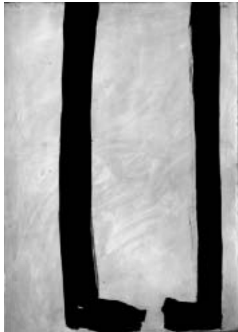
R. Canet. Sense títol 2007. Vinílica sobre paper 174 x 124 cm.