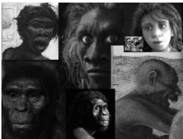
Figura 4. Recreació d'expressions emocionals d'alguns homínids avantpassats de l'Homo sapiens (Homo ergaster, Homo habilis, Homo erectus i Homo neanderthalensis).

Entre les valuoses aportacions que podem trobar a l'obra sobre l'expressió de les emocions, cal