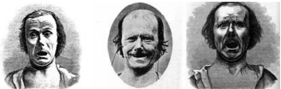
Figura 8. Falses expressions emocionals induïdes per Duchenne a partir de l'estimulació elèctrica de la musculatura facial. Les imatges apareixen a l'obra de Darwin sobre l'expressió emocional (1872).

que defensà més tard William James, l'expressió emocional influeix sobre la nostra vivència emocional, de manera que aquells que expressen més intensament una emoció, també la senten amb major intensitat. Entre les evidències que esmenta Darwin per donar suport a aquesta hipòtesi, destaquen les relacionades amb els experiments duïts a terme per Duchenne, qui, amb l'administració de corrents galvànics que provocaven la contracció de determinats músculs facials, aconseguia reproduir expressions facials semblants a les que apareixen quan sentim determinades emocions: allò realment curiós, i que constituí un dels principals arguments de Darwin per suggerir que la influència emocional influïa en els nostres sentiments, fou que bona part dels subjectes de Duchenne informaven que, quan feia una estona que rebien els corrents galvànics, començaven a sentir una emoció semblant a la que corresponia a la