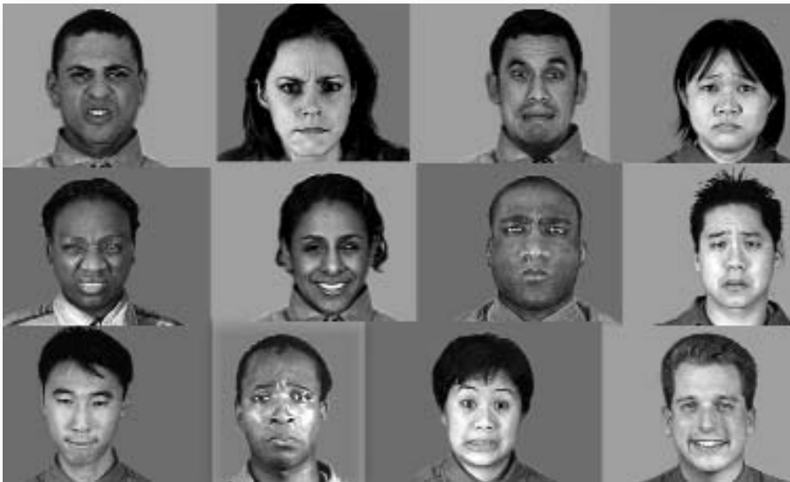
Figura 7. Segons Darwin, l'expressió i el reconeixement de les emocions eren comuns a les diverses ètnies i cultures. La psicologia de les emocions es fa eco d'aquest postulat tot defensant que existeixen una sèrie d'emocions "bàsiques" que són universals

"falsa" expressió induïda elèctricament. Per altra banda, Darwin també al·ludeix al cas dels actors per defensar la seva proposta, ja que, segons havia observat, quan més intensament representaven un determinat estat emocional (fingint expressions facials i corporals), més possible era que l'actor o l'actriu en qüestió acabàs sentint l'emoció que representava. Aquesta observació primerenca de Darwin quallà dins l'àmbit de la ciència en els anys 60 del segle XX, quan tota una sèrie d'investigadors posaren èmfasi en la investigació d'aquest efecte, tot proposant