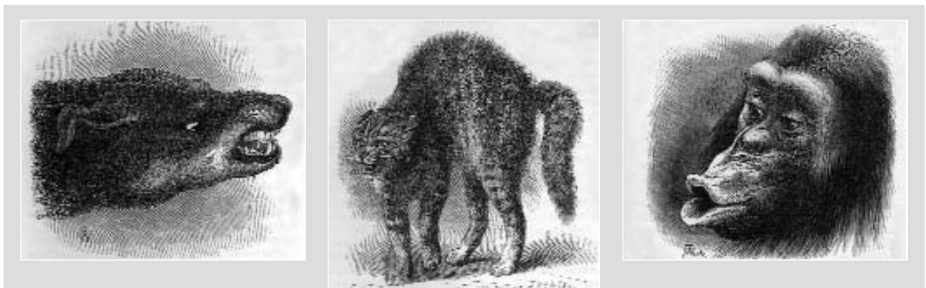
Figures 1, 2 i 3. Il·lustracions d'expressions emocionals a diverses espècies que apareixen a l'obra original de Darwin.

certes variacions, morfològiques i comportamentals, que es produïren en els nostres ancestres i que, en principi, resultaren adaptatives (afavoriren la reproducció), malgrat llavors, al llarg del lent procés evolutiu, moltes perderen la seva funcionalitat inicial i algunes, paulatinament, n'assoliren d'altres, gràcies, almenys en part, al particular procés de socialització que seguien els homínids. Tanmateix, cal subratllar que Darwin, en la seva obra sobre l'expressió de les emocions, explica l'herència dels canvis en la conducta facial des d'una idea errònia d'inspiració lamarckiana segons la qual, per exemple, els hàbits d'expressió establerts i útils ("hàbits útils associats") passarien a la descendència, transformant-se en instints, que, per tant, serien llavors innats per a les generacions posteriors. Al llarg de l'obra en qüestió, Darwin fa referència minses vegades al procés de selecció natural, que havia defensat tot sovint en relació a l'evolució dels trets morfològics (encara que, també en aquest àmbit, Darwin ofereix adesiara explicacions basades