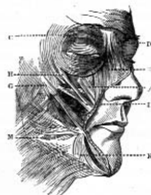
Fig. 2. Diagram from Henle.