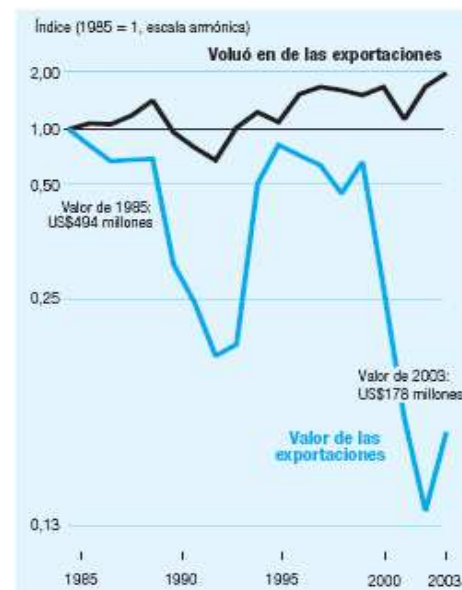
Gràfica 2. Caiguda dels preus del cafè a Etiòpia Font: Informe del Desenvolupament Humà 2005

Per altra banda, el sistema de comerç internacional actual es fonamenta en el que es coneix com a "intercanvi desigual". L'equació de l'intercanvi desigual és ben senzilla: els articles del Centre són cars i els de la Perifèria barats, la qual cosa genera un important dèficit comercial als països del Sud. Aquesta diferència de preus no recau tant en el tipus de productes com en les diferències salarials entre els països -tinguem en compte que els salaris són un dels components més importants del preu dels productes. De fet, els baixos salaris del Sud i el consegüent baix poder adquisitiu de la seva població és una de les principals raons que molts països del Sud -com dèiem en el paràgraf anterior- orientin la seva economia a l'exportació. S'entra així en un cercle viciós del qual es difícil sortir-ne.