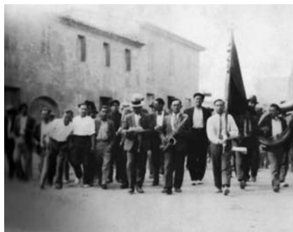
Manifestació del primer de maig a Porreres el 1933.

A partir d'entrat el 1930 es donà a cada illa, això sí, amb distints ritmes i en percepcions de la realitat diferenciades, un important impuls al moviment associatiu, en moltes d'ocasions sorgien noves iniciatives, en el sindicalisme i a les organitzacions culturals. Entitats associatives, que no havien pogut realitzar la seva tasca durant la dictadura de Primo de Rivera, començaren de bell nou la seva activitat. A tall d'exemple parlarem d'algunes realitats, des del 1930 ben avançat fins el juliol de 1936. La tasca associativa del sindicalisme socialista va ésser molt important, les iniciatives socials destacaren, una important tasca de