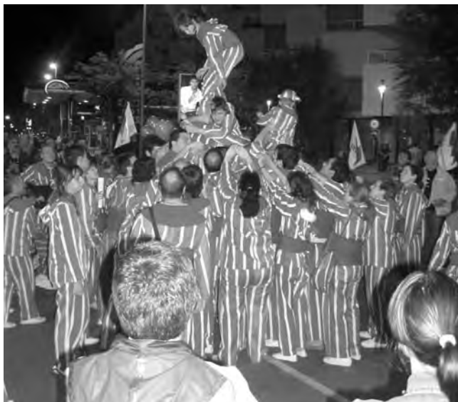
A la manifestació per l'escola pública, muixeranga valenciana.

coneixements, història, tecnologies, idiomes, costums, danses..., VIDA.