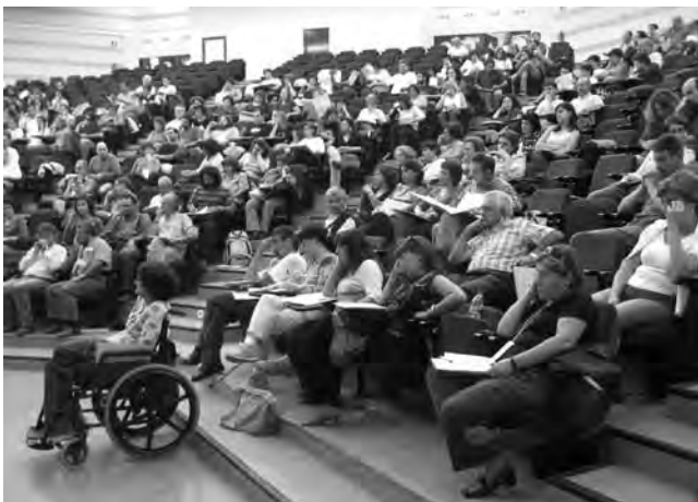
Assistents a una ponència del FSIPE.

Acceptar amb totes les seves conseqüències el fet multicultural hauria de suposar entrar en un procés a mig i llarg termini per arribar a una profunda revisió dels nostres conceptes culturals, jurídics i de convivència.