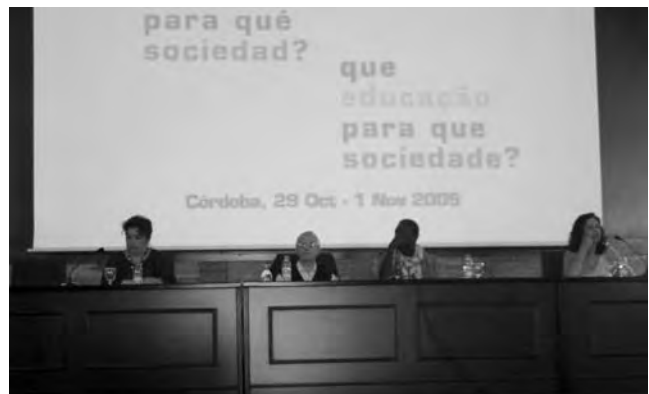
Taula rodona sota el lema del Fòrum.

La denominació de “ víctimes de la immigració clandestina ” que s'utilitza per designar-los és púdica i hipòcrita. Els ciutadans de l'Àfrica subsahariana que moren per milers als camins de l'exili són els màrtirs de la guerra econòmica i comercial que causa estralls als seus països d'origen. Abans d'abandonar les seves terres i les seves famílies, no saben, en la majoria dels casos, què és el desert ni el mar, ni quins són els riscos que hauran d'afrontar per tenir dret a un treball decent, allà, a Europa.