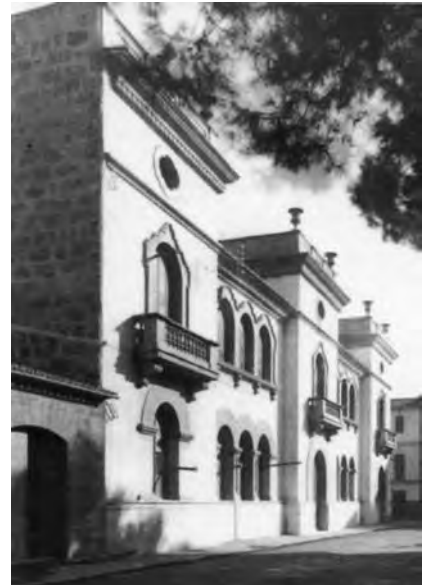
La Casa del Poble de Palma fou l'espai en el qual tenien la seu social les societats obreres vinculades al socialisme.

La presència comunista fou molt important en el Sindicat Únic de la