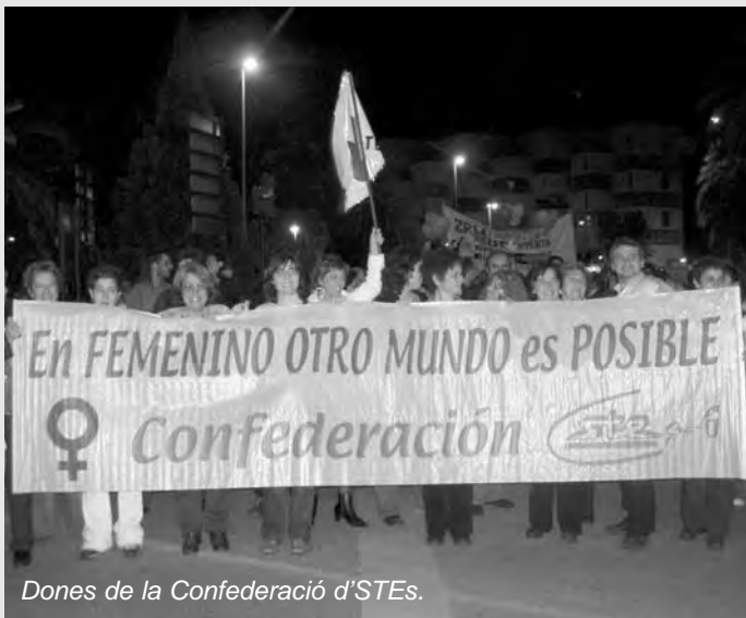
Dones de la Confederació d'STEs.

Les dones de les diverses organitzacions participants en el FSIPE pensem que la nova educació de dones i homes per compartir el món -un altre món- passa per una formació obligatòria i necessària per a ambdós en l'atenció de la casa, de la natura, de les criatures, i en general, per una altra educació emocional i sexual.