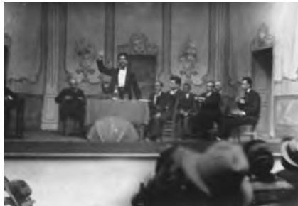
Acte sindical a la Casa del Poble de Palma en els anys trenta.

Quan es va constituir la SBTE, bona part de la societat illenca estava dividida entre els que donaven suport als canvis introduïts en l'ensenyament i els que s'hi oposaven aferrissadament. En aquests