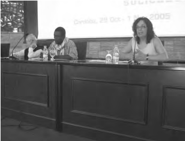
Exposició de la iniciativa per Mali.

Els seus camperols estan condemnats a acceptar, per a la campanya de l'any 2005, el preu irrisori de 160 francs CFA per quilo de cotó en gra enfront dels 210 francs de 2004, mentre que els Estats Units d'Amèrica i la Unió Europea concedeixen subvencions als seus propis productors de cotó i mentre que a Liverpool els cotoners, com tots els anys, brinden per la grandesa del liberalisme.