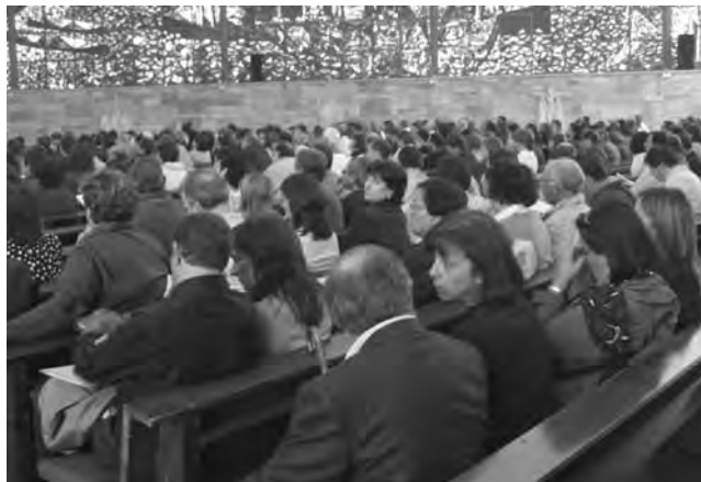
Panoràmica general dels assistents a un acte del FSIPE.

És precisament per aquest desajust pel qual des de fa anys diversos col·lectius "gltb" venim treballant per intentar trencar el mur de silenci que continua existint sobre la nostra diferent orientació sexual a l'escola. No obstant això, i malgrat que els èxits aconseguits són importants, estem encara ben lluny d'haver arribat a un model educatiu igualitari, no sexista, ni heterosexista. És ben veritat que, tenint en compte quin ha estat el punt de partida (la criminalització social), el camí recorregut és molt satisfactori.