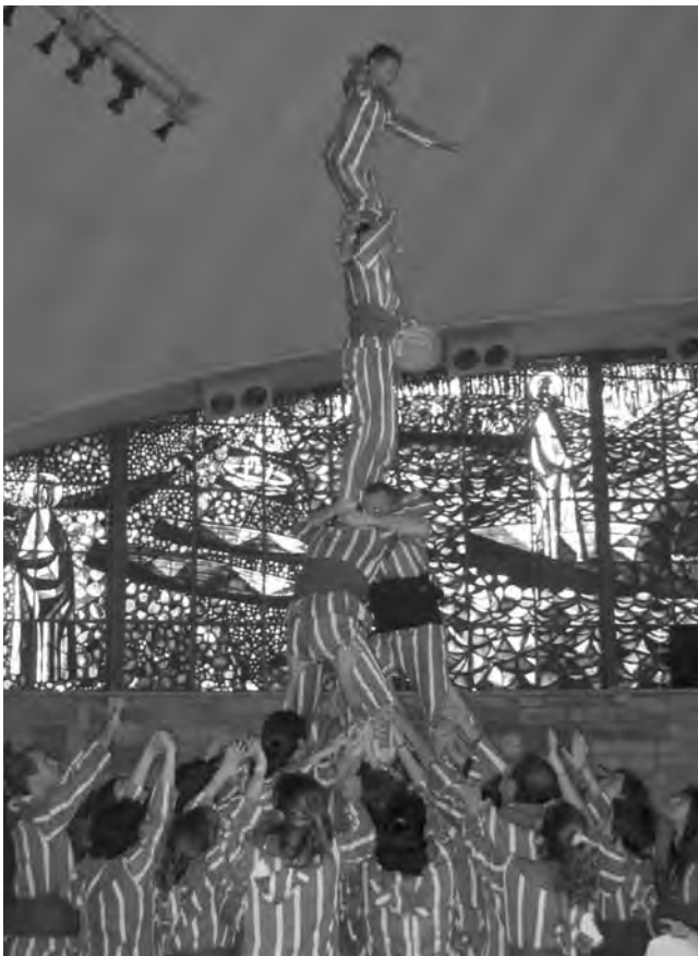
Acte lúdic de cloenda del FSIFE.