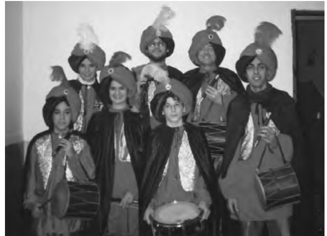
Participació a la colcada de reis de s'Arenal.