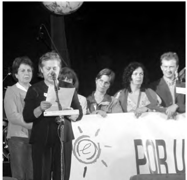
Parlament final a la manifestació per l'escola pública.

Diu que Wallerstein avisa que si els moviments antisistema no tenen clara la seva orientació ideològica, poca cosa podran fer contra el neoliberalisme. També parla del paper dels intel·lectuals i cita Bordieu: “Hem de