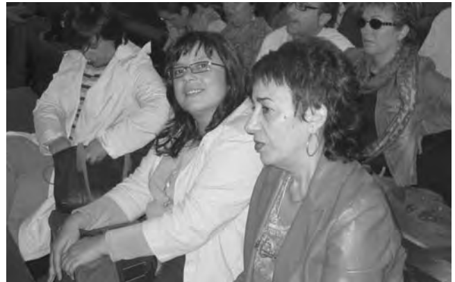
Representants de l'STEI-i al FSIPE.

"...creiem que també per a l'alumnat heterosexual [...] és important abordar des d'una perspectiva normalitzadora el fet gai/lèsbic."