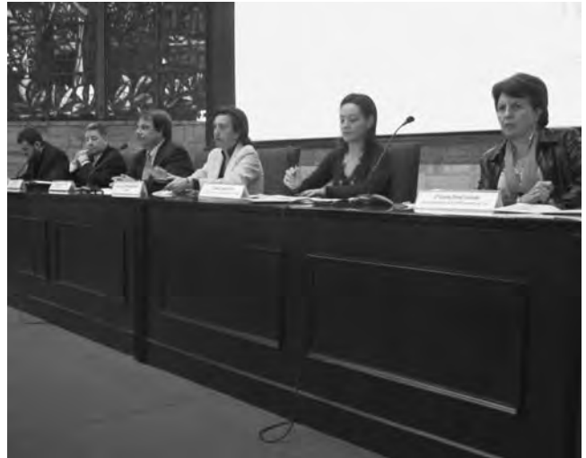
Taula rodona al FSIPE.

Per això assumim com a trajecte eticopolític del nostre treball que els mitjans pedagògics que utilitzem han de passar sempre per l'evidència crítica que cadascun d'ells transmet, amb la coherència més elevada: els fins democràtics de l'educació que en cooperació estem construint. O sigui, cada procediment a l'escola ha de subjectar-se als valors de la justícia, als del respecte mutu, als de la lliure expressió, del suport solidari i de la reciprocitat en les relacions de treball i de vida.