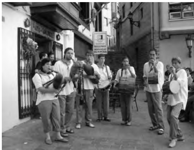
Actuació als carrers de Bermeo, País Basc.

Acabava així el segon any de la banda, amb la certesa de saber que era impossible plantejar-se l'ensenyament d'aquests instruments d'una manera tan voluntariosa i sense recursos. □