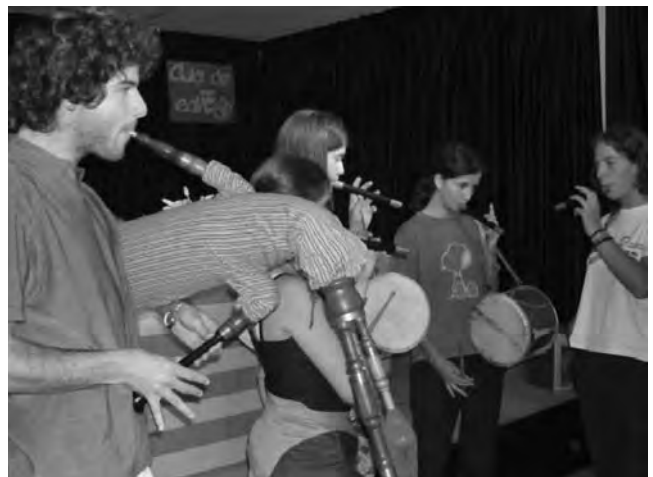
Actuació a la setmana Alcover Moll.

En resum, aquest fou un curs d'introducció, de presentació dels instruments i el seu repertori a un medi, el del jovent aclaparadorament immigrant de l'Arenal, que viu alienament a la cultura tradicional de Mallorca.