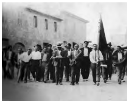
Manifestació del primer de maig a Porreres el 1933.

A partir d'entrat el 1930 es donà a cada illa, això sí, amb distints ritmes i en percepcions de la realitat diferenciades, un important impuls al moviment associatiu, en moltes d'ocasions sorgien noves iniciatives, en el sindicalisme i a les organitzacions culturals. Entitats associatives, que no havien pogut realitzar la seva tasca durant la dictadura de Primo de Rivera, començaren de bell nou la seva activitat. A tall d'exemple parlarem d'algunes realitats, des del 1930 ben avançat fins el juliol de 1936. La tasca associativa del sindicalisme socialista va esser molt important, les iniciatives socials destacaren, una important tasca de