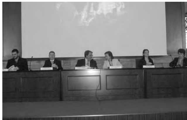
Inauguració del Fòrum Social Ibèric.

[...] La mercantilització del sistema d'ensenyament es posa de manifest en què el desenvolupament ple de la personalitat dels alumnes deixa de ser l'objectiu principal del procés d'ensenyament cedint aquesta posició a la seva contribució, mitjançant l'especialització professional dels seus alumnes, al desenvolupament de la capacitat