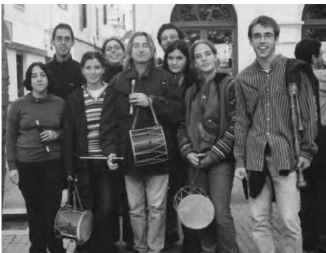
Primera participació dels XSV a la trobada anual de sa Pobla.