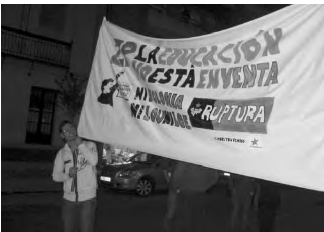
Pancarta de la manifestació.

Es prevé la violència construint un altre món possible, un altre món que ja existeix, si bé no és en tot el món on es destrueix l'arquetip viril i el seu model de masculinitat de societat, economia i ciència i es dóna prioritat a altres maneres de ser home i dona, i a altres maneres