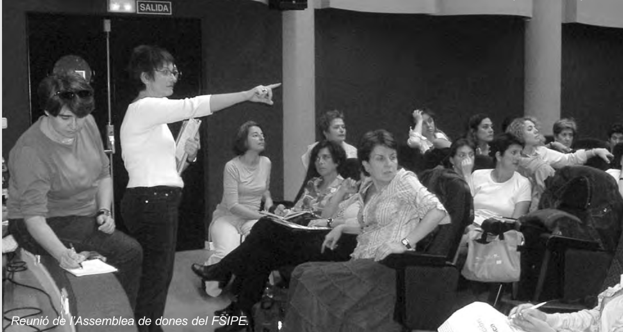
Reunió de l'Assemblea de dones del FSIPE.

Les dones de les diverses organitzacions participants en el FSIPE pensem que la nova educació de dones i homes per compartir el món -un altre món- passa per una formació obligatòria i necessària per a ambdós en l'atenció de la casa, de la natura, de les criatures, i en general, per una altra educació emocional i sexual.