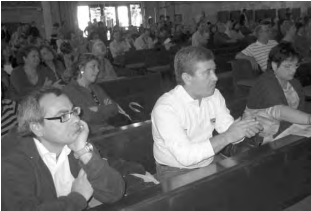
Membres de la delegació de la USTEC-STEs de Catalunya.

Al costat d'aquest reconeixement de la formació, també ha de ser reconeguda oficialment la professió de la persona mediadora. Amb freqüència, és difícil entendre i donar-los un lloc adequat, perquè no és una capacitació reconeguda. Excepte la bona voluntat de bastants professionals, que volen assumir aquest nou espai d'acció social, és normal que es relegui a papers secundaris els mediadors/es.