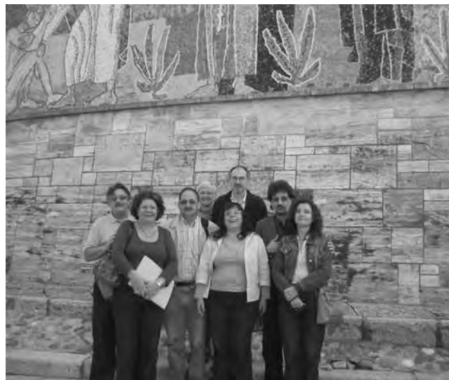
Delegació de l'STEI-i al FSIFE.

Un altre dels aspectes on es pot observar l'arquetip viril és en les relacions amoroses. Als instituts, sobretot a l'ESO, podem observar ja models amorosos dominants i pautes de relació no justes. Veiem com molts al·lots riuen, menyspreen desqualifiquen o no consideren les