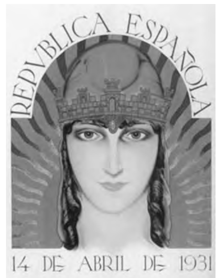
Cartell commemoratiu de la República.

És ben evident que la tragèdia de la guerra entre el 1936 i el 1939 i les seves conseqüències no es poden deslligar del plantejament que feim en analitzar la Segona República, però sí que pens que val la pena ésser ben conscients del que va significar de positiu la seva proclamació el 14 d'abril de 1931.