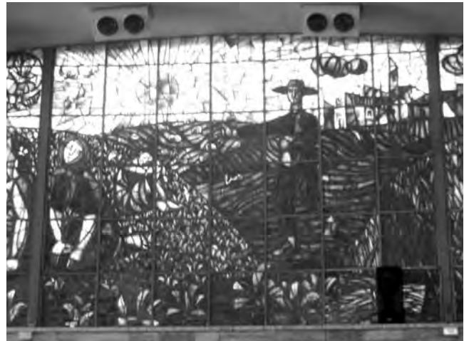
Detall de les vidrieres de la Universitat de Còrdova.

Per als optimistes els diré que l'Estat espanyol no és, en aquesta llista, l'últim de la fila . Hi ha dos països de la UE, Portugal (45%) i Malta (53%), que ens superen, i no oblidem que l'abandó educatiu primerenc no afecta per igual tot l'alumnat, perquè és un fet no discutit per ningú que la permanència en el Sistema Educatiu depèn de la classe social. Estem ben lluny de caminar cap a la confluència on la classe social a què es pertany no marqui el teu futur escolar i, en conseqüència, el futur laboral i social. Permetrem que l'escola del segle XXI, igual que en segles passats, persegueixi un únic objectiu, afavorir els afavorits i desfavorir els desfavorits ? Perquè