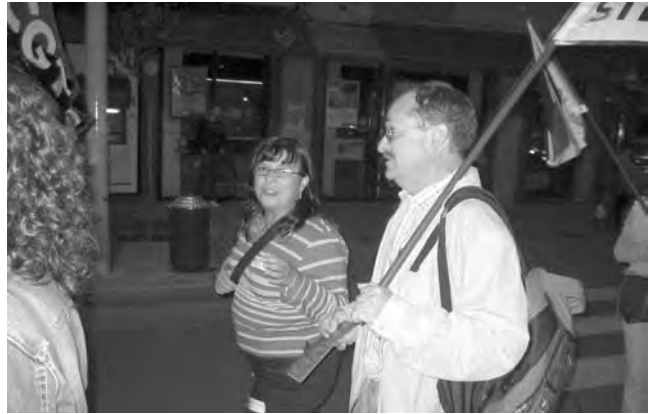
Participació d'Eivissa i Menorca a la manifestació per l'escola pública.

[...] L'assignatura de religió forma part dels plans d'estudis a l'escola primària i secundària d'aquests països, encara que hi ha algunes diferències entre els uns i els altres. Algèria, per exemple, està decidida a eliminar l'ensenyament religiós a l'escola secundària, com a mesura per resoldre el radicalisme religiós. Tunis desenvolupa l'ensenyament de la religió per adequar-la als temps moderns. El Marroc ha reduït, aquest curs, les hores de l'assignatura de religió de dues setmanals a una hora, a l'escola secundària. A la resta del món àrab ha seguit el seu camí tradicional: ni eliminació ni modernització. L'assignatura de religió a Síria forma part essencial del programa d'estudis, ja que cada alumne (des de primer de primària a tercer de secundària) estudia de dues a tres hores setmanals la religió musulmana o la cristiana, encara que la nota d'aquesta assignatura no compta per a la mitjana anual.