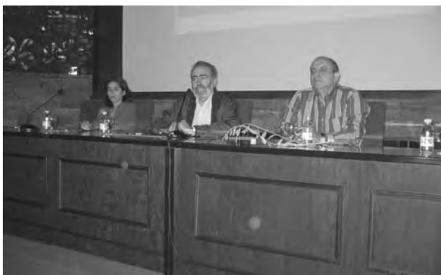
Taula rodona al Fòrum.