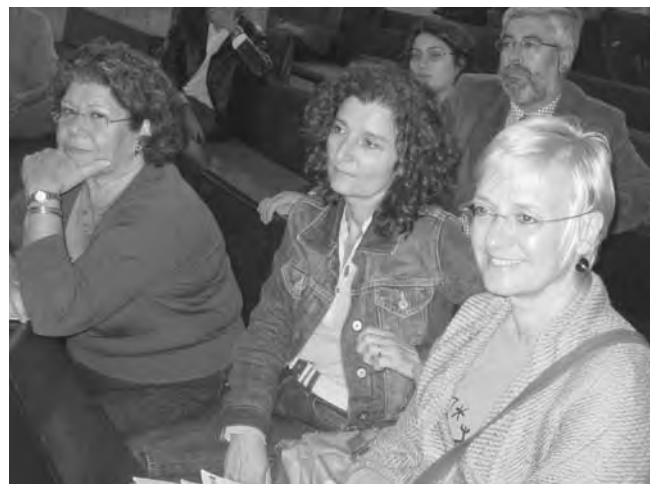
Presència de l'STEI-i al FSIFE.

Cita Derrida i Giddens, declarats no marxistes, que diuen que l'anàlisi de Marx no ha estat superat per ningú. Cita el capítol primer d' El Capital , el que parla de la força del treball, dels mitjans de producció, de la plusvàlua, del productor, del producte i del salari. Diu que sorgeix el capitalisme quan la força del treball es converteix en mercaderia i es venuda pel seu titular per obtenir mitjans de subsistència. Diu que és en la compra de la força del treball que s'amaga la transformació dels doblers en capital. També afirma, seguint Marx, que la propietat privada transforma els mitjans de producció en fins als quals queda subordinat l'home i que no és el treballador qui utilitza els mitjans de producció, sinó a l'inrevés. Amb tot això afirma que és la propietat privada la que aliena l'home en un procés impersonal de la seva transformació de fi en mitjà, de persona en instrument de la seva pròpia dominació. I aquest seria un bon principi, si tengués temps, per parlar del que pensaven Marx i Engels sobre la intervenció de l'Estat en l'educació, en un estat capitalista. Després parla de la possibilitat de comerciar sense mercaderies, els que presten un servei són reduïts a assalariats i es converteixen en un engranatge del procés de producció. És per