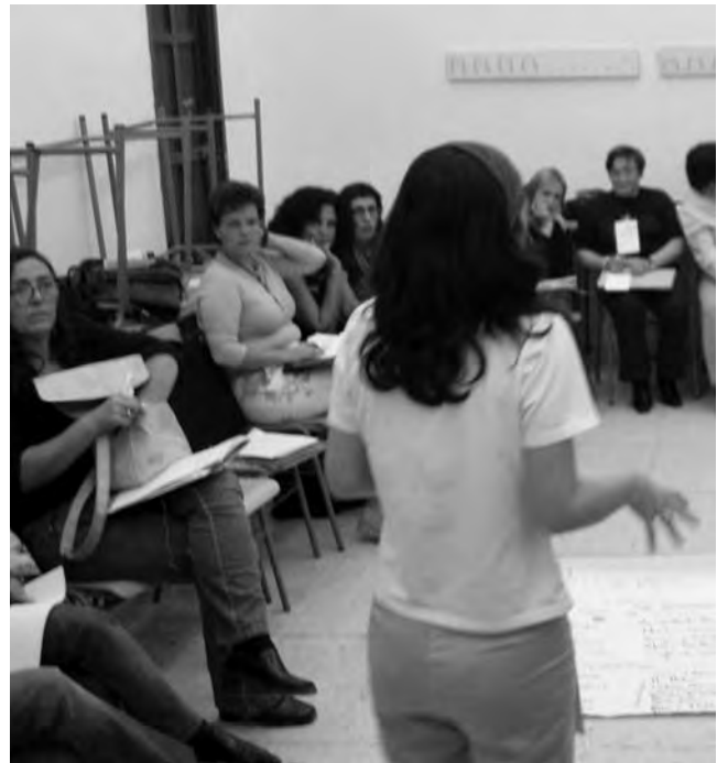
Un seminari del Fòrum.

En el cas del sistema d'ensenyament i en la seva relació amb la mercantilització i la privatització objecte d'aquesta reunió reflexiva, pens que almenys cal tenir en compte dos objectius estratègics que serveixin com a referent de cap a on han de dirigir-se les reformes que actualment es discuteixen: