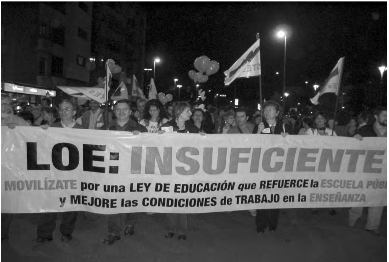
Pancarta confederal dels STEs sobre la LOE.

l'arribada d'aquests col·lectius no succeirà de forma automàtica, sinó que necessita, entre d'altres mesures, de la formació d'agents o mediadors/es interculturals capacitats per gestionar i facilitar els processos d'integració. Una integració que a "Sevilla Acoge" ens agrada definir com "la trobada entre dues identitats que es donen sentit mútuament en una relació social i en un context a definir cada cop".