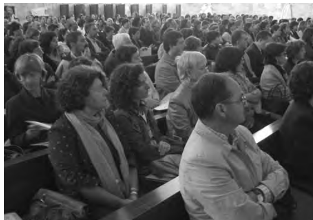
Representants de l'Stei-i al FSIFE.

Vaig voler recordar alguns equívocs de l'escola i realçar allò que ens correspon a tots i, en particular als