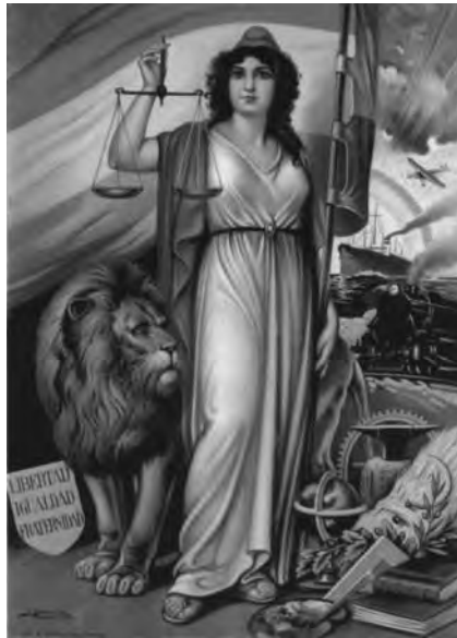
Estampa de l'al·legoria de la República.

obreres. A més, les existents i consolidades en el panorama sindical, veieren augmentar espectacularment el nombre d'afiliats. Al marge de les possibilitats propagandístiques, una conseqüència directa de tot això fou l'augment dels fons o caixa de resistència de les diferents societats, donat que amb l'augment de la sindicació obrera hi hagué un augment de la cotització sindical. Mai les societats obreres de resistència no havien disposat de recursos econòmics semblants amb els que poder desenvolupar la seva activitat reivindicativa i sindical.