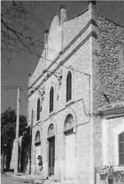
Esportes fou un dels municipis amb més efervescència obrerista durant la República. A la fotografia, la Casa del Poble.

Però a l'hora de la memòria històrica existeixen també un conjunt de qüestions que pens que he d'esmentar. Una d'elles fa referència a una important tasca de petits col·lectius de republicans a nuclis