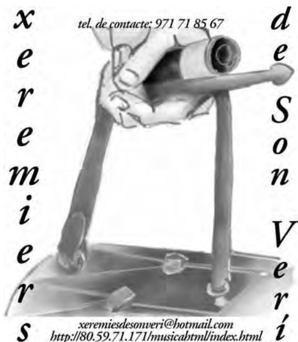
Targeta dels XSV.

persones, entre alumnes i professors del centre, interessats a aprendre a tocar aquests instruments i l'octubre començaren les classes els divendres capvespre al centre. Tot i que el primer trimestre la banda i l'escola de formació funcionaven autònomament i eficientment, ben aviat ens vérem desbordats tant per alumnes, com per temps. Era molt difícil engegar un projecte docent sense cap recurs econòmic i sense que els professors cobrassin. S'ha de tenir en compte que aleshores l'ajuntament de Lluçmajor acabava de crear a s'Arenal una banda municipal on els alumnes cobraven per assaig i rebien gratuïtament l'instrument. Perquè ens facem la idea de la magnitud de la barrudesa municipal només cal saber que el pressupost d'un sol clarinet (i el nombre de clarinets a una banda de música és l'equivalent al de violins a una orquestra) equivalia a tot el nostre pressupost anual per a la compra d'instruments per als nous alumnes.