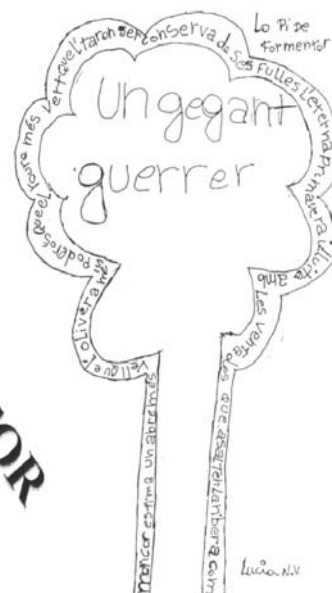
Il·lustracions cedides pel CP Rafal Vell

Aquestes són algunes activitats de les múltiples que la poesia d'Alcover i Costa suggereixen. Segur que qualsevol lector en sabria afegir encara més de la seva pròpia collita. Ànim, doncs, i endavant. Cal tenir present, a més, que el treball amb els nostres autors té encara un valor afegit per als alumnes de les Illes Balears: els proporciona referents culturals propis i compartits amb la resta de territoris de llengua catalana.