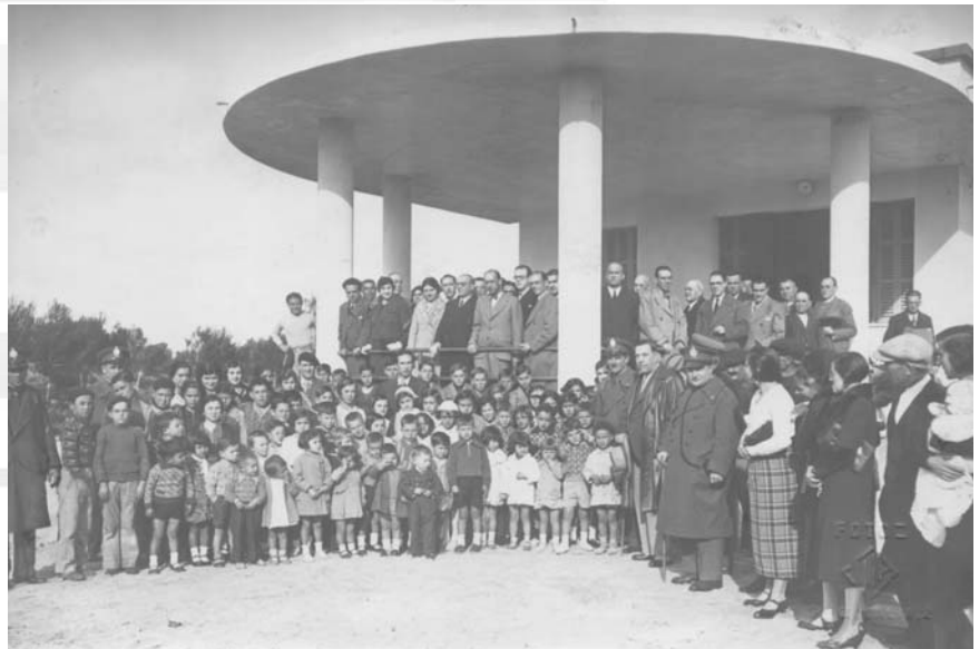
Inauguració d'una escola durant la II República.

ri... Però la majoria d'aquests espais eren buits. Algun es feia servir per amuntegar els pupitres espanyats, un altre l'havien convertit en el magatzem de la mica de llenya que nosaltres portàvem per a les estufes: un duia quatre estelles d'ullastre, l'altre, una senalla de clovelles d'ametlla. Els mestres ens suggerien d'acudir a la via del tren, per si els fegoners havien extraviat cap tros de carbó. El recollíem i el portàvem a l'escola. Un dia, tres companys ens perdérem ran de la via. I no anàrem a classe, ni acudírem a dinar. Els pares ens cercaren, preocupats, en veure que no compareixíem. Però retinc a la memòria la llargària de les vies ran de les quals caminàrem durant tres o quatre hores. Es perdien en l'horitzó de la mirada, en un llunyedar misteriós. Els franquistes s'havien proposat enderrocar tots els rastres de la Pedagogia republicana i havien assegurat que no en quedaria ni una sola pedra. Processaren els mestres, a alguns els mataren, a d'altres els tancaren