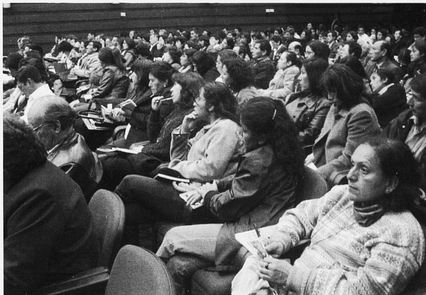
Panoràmica dels assistents al Seminari Polítiques de formació docent i lluita contra la pobresa.

- Els canvis en l'estructura demogràfica fan preveure que en els pròxims anys la demanda dels serveis educatius en educació bàsica decreixeran en termes relatius, però seguiran augmentant en menor proporció en termes absoluts. Això significarà un creixement menor en la demanda de professors d'educació inicial, primària i