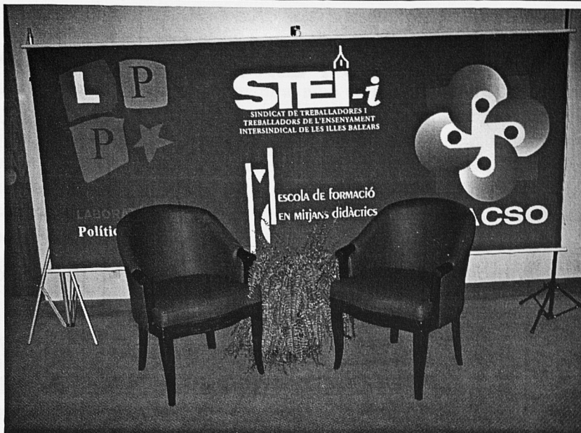
Lloc d'entrevistes a participants i personalitats de l'FSM

ha moltes històries que acaben així, però aquesta encara no està acabada. Comença a ser escrita per moltes mans de diversos pobles de distints noms, costums, tradicions i cultures. Per aquells que varen resistir i continuen resistint. Davant nosaltres tenim el desafiament de construir el III Fòrum Mundial d'Educació i, perquè pugui aportar les distintes realitats i alternatives, fer-lo en diverses regions del planeta. D'aquesta manera, les parts constituiran un tot més harmònic, comptant amb els rostres i cossos dels exclosos de cada poble, perquè ells són precisament la font per somiar i construir un altre món. I com els indis que han de conèixer el lloc on va ser enterrat el seu llombrígol, doncs allà va néixer que vaig contar aquesta història tan igual a tants de pobles