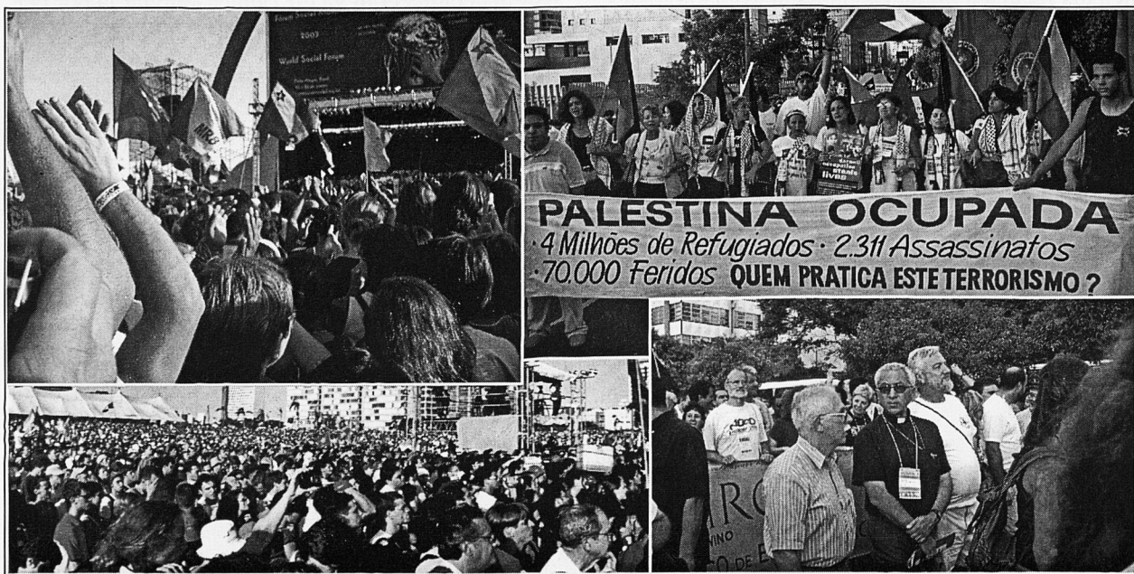
Imatges de les manifestacions i concentracions a Porto Alegre durant l'FSM

"Els esperits xapiripè ballen per als xamãs des dels primers temps i així continuen fins avui. Els blancs dissenyen les seves paraules perquè el seu pensament està ple d'oblits. Nosaltres guardam les paraules dels nostres avantpassats dintre nostre des de fa molt de temps i continuam pensant-les per als nostres fills. Els nins, que no saben res d'esperits, escolten els cants dels xamãs i després volen veure els esperits. És per això que, malgrat ser