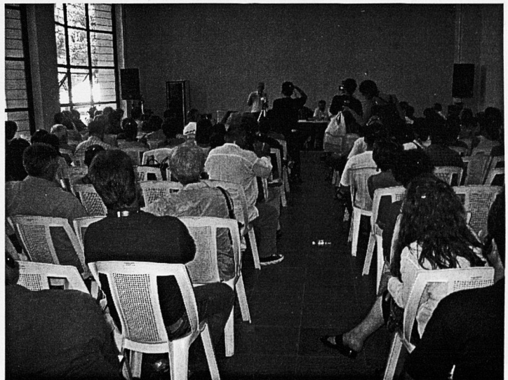
Una de les meses de debat de l'FSM

Brasil és en l'actualitat un dels països amb majors desigualtats del món, on el 50% dels més pobres tenen tot just un 10% de la renda i en el qual l'1% dels propietaris posseeix el 46% de totes les terres. Tan sols vuit grups econòmics familiars controlen els principals mitjans de comunicació. En l'àmbit de l'educació hi ha un contingent de 20 milions d'analfabets absoluts i altres 30 milions que no han arribat ni a completar els quatre anys d'escolaritat. Menys de la meitat dels nins i nines de quatre a sis anys freqüenten algun centre de preescolar. Entorn