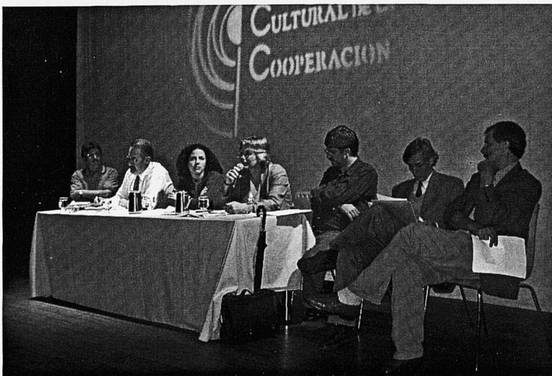
Taula rodona sobre "La Guerra Imperial" celebrada a Buenos Aires

Durant quatre intenses jornades els encontres, les mirades i complicitats, les afirmacions i preguntes van generar una atmosfera càlida on les diferents veus es van expressar i es van escoltar, obrint fluxos d'interacció i comunicació on es va compartir la necessitat de tenir present una perspectiva de realisme i utopia que permeti, en moments de foscor, de desencant i d'interrogació, deconstruir el pensament únic per tornar a construir una nova realitat més humana i més justa. En aquest marc, es va tornar a creure en l'educació, en les seves