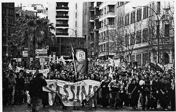
Les manifestacions contra la guerra ompliren els carrers de tot el món

polítics i econòmics entre governs, sinó que haurà de sustentar-se també en la solidaritat intel·lectual i oral de l'espècie.