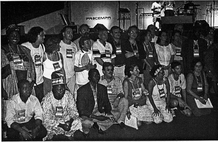
Grup de convidats a parlar a l'FSM

"els intel·lectuals de cafè parlen de la pau, però no coneixen el vertader sacrifici que constitueix aconseguir-la en la por de la guerra". Per tant, la tasca ha de considerar tots els temps i els espais possibles per on l'ésser humà transita, sabent que el millor diagnòstic és el que es fa mitjançant l'autòpsia del cadàver. Deurem llavors actuar, la major part de les vegades, per raons morals, ètiques i humanitàries i fins i tot sense el coneixement ple, però guiats pel sentit comú d'allò que ens caracteritza i identifica com a espècie. Tal acció transformadora no podrà ocórrer si pensem que la construcció de la pau és sinònim d'apaivagament en el sentit d'habilitar treves, espais transitoris de negociació que caducaran promptament i retornaran a aquest cercle diabòlic on els ritmes de vida, la mort, la pau, la violència, el dolor, es retroalimenten sense fi.